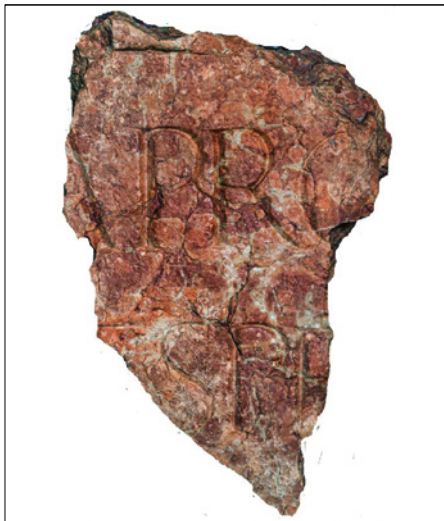
Figura 7 Frammento lapideo iscritto. Ristorante Gellius, Oderzo.

che condivideva il prenome e il gentilizio con Volcacio. Nel caso invece si tratti del nomen Sagatius la compagna di sepoltura doveva essere necessariamente una donna, vista l'assenza del prenome nella formula onomastica. 37 La paleografia e l'onomastica orientano verso una datazione in prima età imperiale.