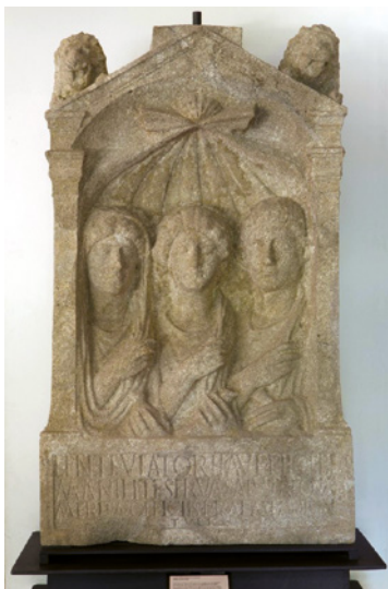
Figura 9 Stele sepolcrale di Phoebe. Museo archeologico Eno Bellis. Fondazione Oderzo Cultura onlus. Oderzo.

duta; i tre personaggi sono colti nell'atto di trattenere le pieghe del manto; le due donne tengono in mano, una un balsamarario e l'altra un uccellino, mentre il dominus impugna il volumen . Il codice iconografico adottato per la schiava imita quello dei liberi (pettinatura femminile 'alla Agrippina', abito della festa, gesti convenzionali, semantica allusiva a forme di religiosità dionisiaca ed escatologica); Febe si distingue dalla domina solo perché la matrona indossa la stola ed è rappresentata capite velato , mentre la schiava veste la tunica. Dal forte impatto anche la scelta di ricorrere alla Musa lapidaria, operata spesso nella Regio X da appartenenti ai ceti subalterni, desiderosi di compensare il deficit sociale attraverso l'adozione di un formulario in versi avvertito quale sfoggio di cultura; 41 altrettanto connotante l'opzione di interpellare il passante per ottenere attenzione. Il caso non è raro: il dialogo con il viandante si dispiegava solitamente secondo la seguente sintassi convenzionale: al saluto valeas del lettore il defunto rispondeva con l'espressione et tu cui seguiva, da parte del primo, la formula augurale sit tibi terra levis alla quale il secondo ribatteva con la clausola et tibi . Il copione era così ben conosciuto e il codice interpretativo tanto noto che era possibile omettere le battute del lettore per privilegiare la sola voce del defunto, senza pregiu-