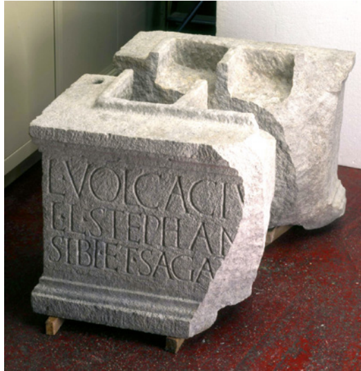
Figura 8 Urna sepolcrale di Lucio Volcacio Stefano. Museo archeologico Eno Bellis. Fondazione Oderzo Cultura onlus. Oderzo.

Il testo conservatosi è metrico e corrisponde a un distico elegiaco: 38