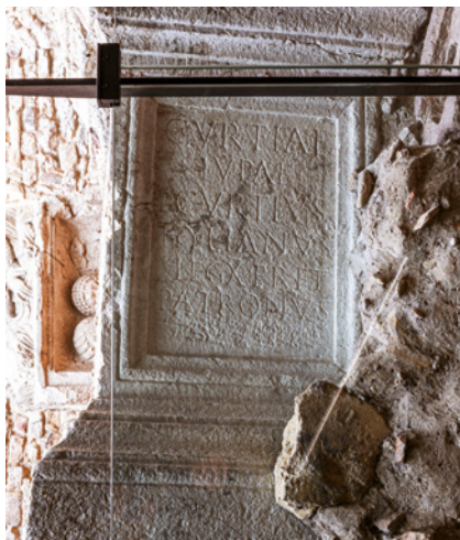
Figura 5 Base di statua funeraria di Curzia Lupa. Ristorante Gellius, Oderzo.