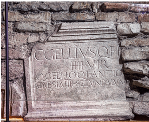
Figura 1 Frammento sinistro dell'urna sepolcrale di Gaio Gellio. Ristorante Gellius, Oderzo.