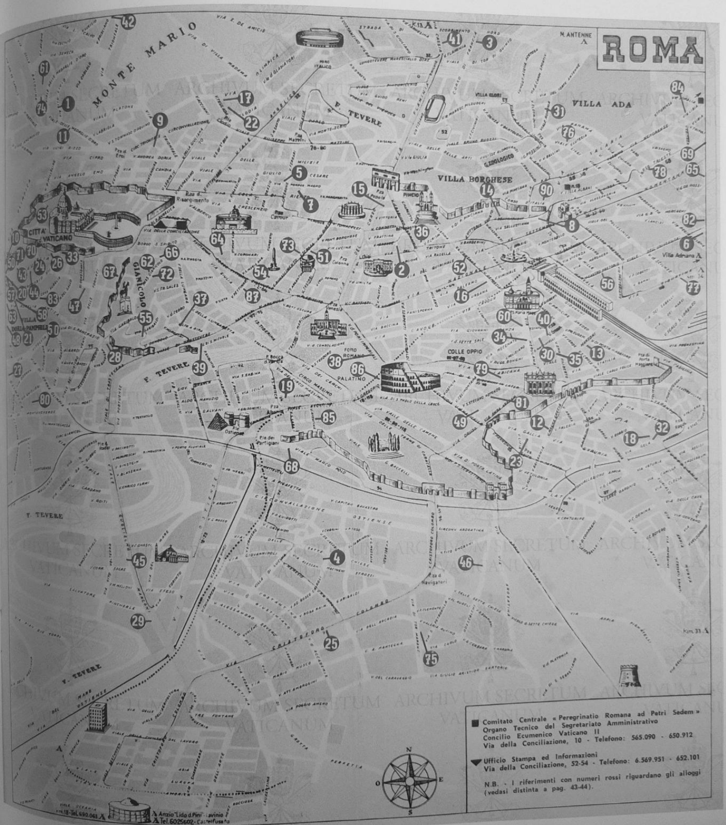
3. La cartina di Roma, distribuita ai padri conciliari (Archivio Segreto Vaticano).