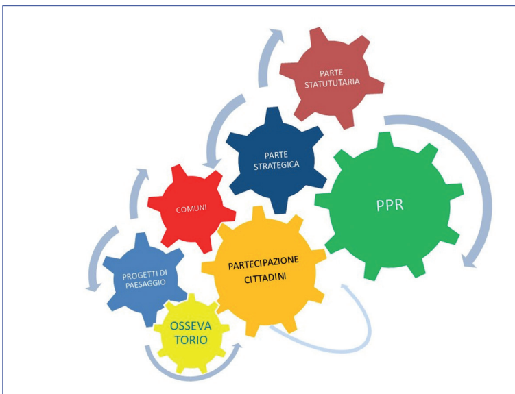
Figura 4 L'ingranaggio delle relazioni per un Piano del Paesaggio dinamico e partecipato. Elaborazione dell'Autore

dia, la sua gestione e la sua pianificazione implica diritti e responsabilità sia individuali che collettive.