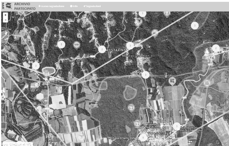
Figura 3 L'interfaccia grafica dell'Archivio partecipato delle segnalazioni online. Piano Paesaggistico Regionale del Friuli Venezia Giulia

le autorità locali e i cittadini, di fatto ha voluto consegnare alle comunità locali e ai decisori un patrimonio di conoscenze e di progettualità che rappresentano la base per la costruzione di un paesaggio di qualità e a 'regola d'arte'.