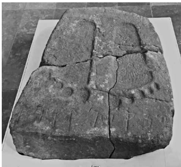
Fig. 1 – Buddhapāda , c. I secolo a.C. (Tirat, Swat, Pakistan); Swat Museum

sedici arhat o discepoli di Śākyamuni – il Buddha storico stesso impose al monaco di concentrarsi sulla polvere e sullo spazzare, come metafora della pulizia della mente. Mente come specchio su cui la polvere si accumula fino a rendere la visione offuscata al punto da rendere l'uomo cieco. Secondo un'altra velatura, la presenza del Buddha storico è testimoniata dalle sue impronte, lasciate nella polvere delle cose, come