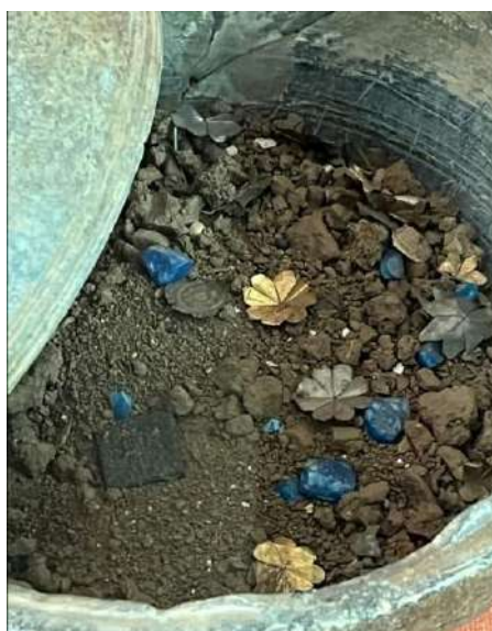
Fig. 2 – Contenuto del reliquario di Pataka, c. I secolo d.C. (Swat, Pakistan); Peshawar University Museum.

Queste pissidi sono quindi deposte all'interno della cista funeraria coperta dal tumulo dello stūpa . In questo senso, la polvere è la prova che il processo è