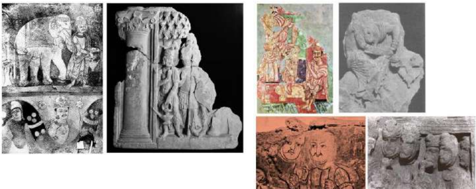
Figg. 5-6 – Rilievi dal Fregio di Saidu (I sec. d.C.), Swat Museum paragonati alle pitture dei templi V e III di Miran (III-IV secolo d.C.), (Miran, Xinjiang, Cina).

La committenza buddhista di Miran V non ha problemi a illustrare una pittura murale che narri una vita precedente del Buddha storico come principe Viśvantara (il Viśvantara-jātaka ) con contenuti formali copiati da pannelli di fregio scultoreo che tre-quattro secoli prima illustravano la vita del giovane Siddhārtha, prima che questi divenisse il Buddha 21 . Allo stesso modo la committenza buddhista di Saidu Sharif al tempo di re Senavarma non ha problemi a usare il modello del Filottète seduto o di Eracle che solleva Anteo per scene che con quei personaggi nulla hanno a che fare. Si tratta di contaminazioni di soggetti, che, come aveva intuito Alessandro Della Seta, passano per via tecnica non per contenuto. Il loro contenuto nel tempo, e nei passaggi può essere perso, dimenticato: non fa nulla, tanto il modello verrà comunque trasformato, e tra i modelli verrà comunque preso quello che dica già qualcosa al nuovo fruitore ( in primis all'artista e quindi al committente). Adattamento non adozione.