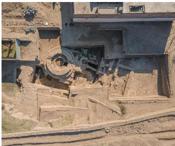
Fig. 4 – Veduta aerea del Tempio H, III secolo a.C.-V secolo d.C. (Barikot, Swat, Pakistan).

Questi test hanno dato esito positivo, incoraggiandoci a cercare di estrarre profili odorosi caratteristici delle molecole previste e di altri composti volatili dalle polveri depositatesi sulle pareti e sul fondo dei bruciatori. Lo studio è ancora in corso.