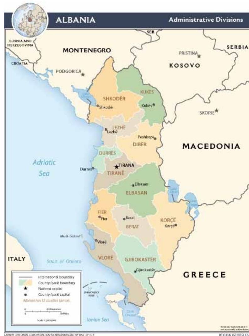
Mappa 18 2: Albania 2010.

funzione delle istituzioni democratiche e dello stato di diritto sembra essere ancora una scelta audace/auspicabile nell'intera Balkania.