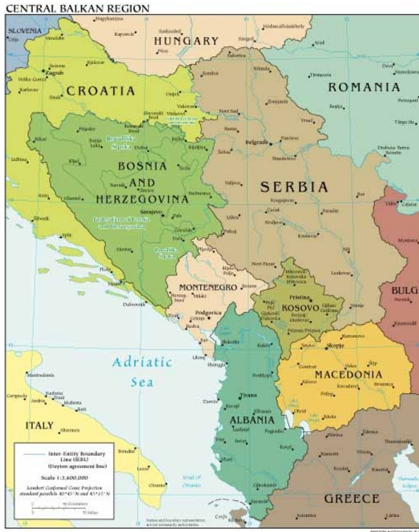
Mappa 17 1: I Balcani 2008

Anche se geograficamente i Balcani sono parte dell'Europa, la loro storia travagliata ha lasciato impronte di divisioni etniche, culturali, religiose, economiche e politiche profonde che li distanziano nel tempo. Nonostante la posizione geografica di questa parte extra dell'Europa, è risaputo che nell'Europa occidentale si possiede una conoscenza limitata e stereotipata della storia e della cultura "balcanica". Di conseguenza, si ha una percezione erronea degli individui appartenenti e portatori di queste culture "astratte" in emigrazione/immigrazione. L'iniziazione con la cultura del sudest europeo attraverso il contatto con gli stessi individui/immigrati ha provocato forte reazioni da parte dei cittadini