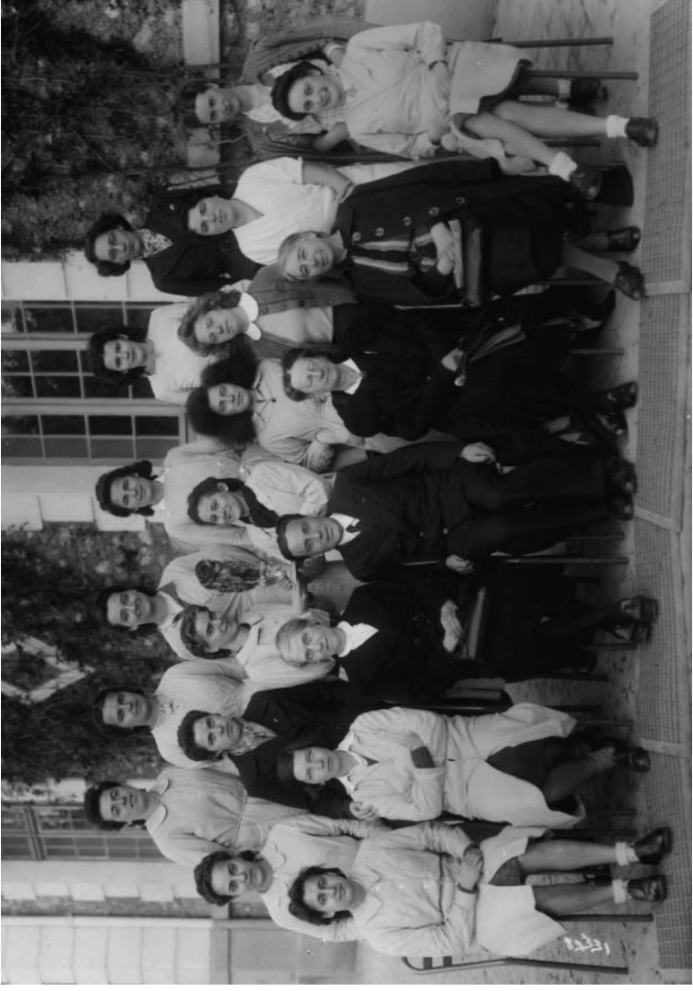
Première supérieure à Versailles en 1948