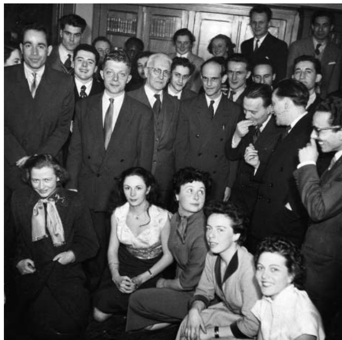
Dans les années 1950.