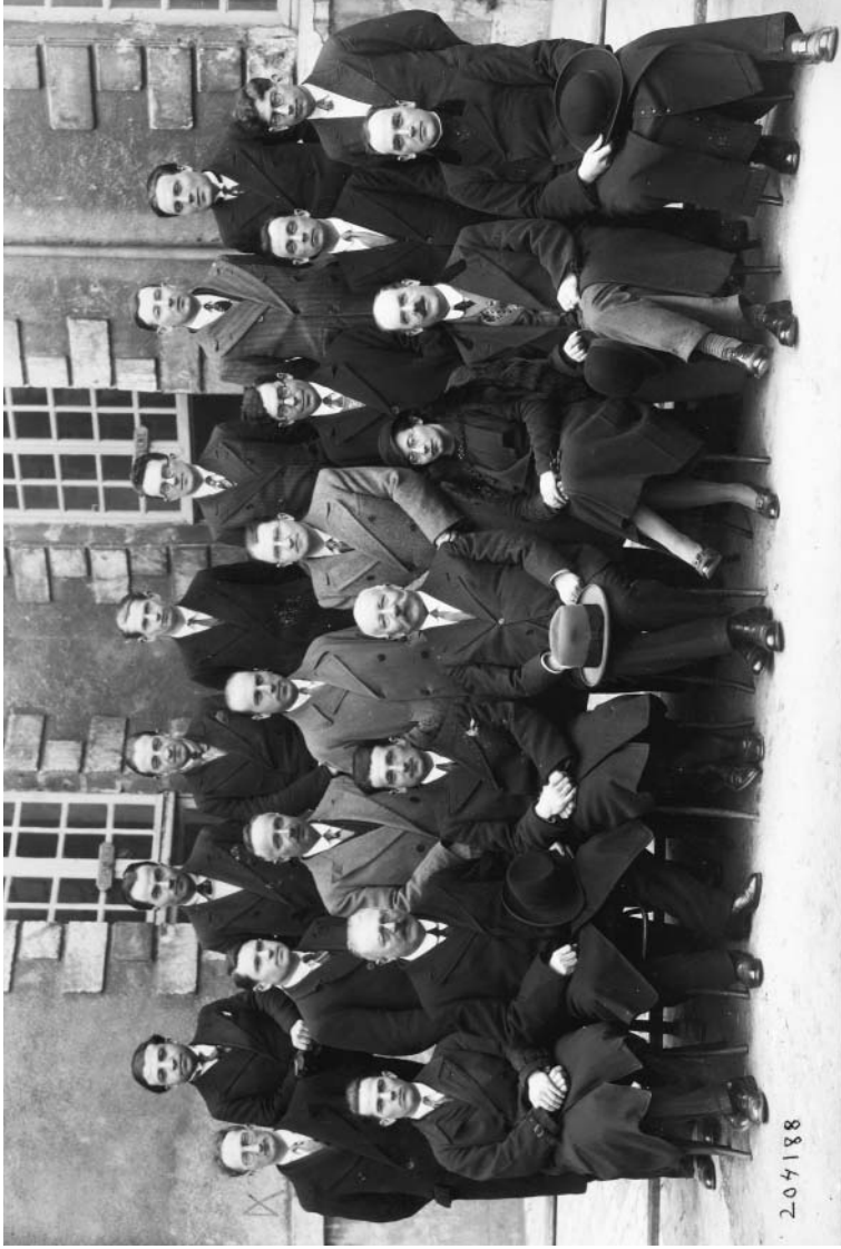
Lycée de Bourges 1932-1933