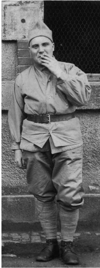
Service militaire en 1930-1931 à Limoges.