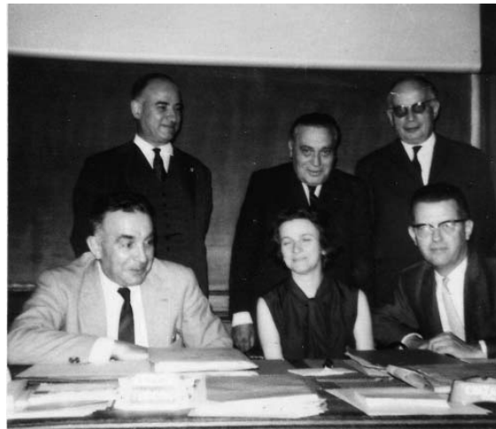
Jury d'agrégation en 1964.