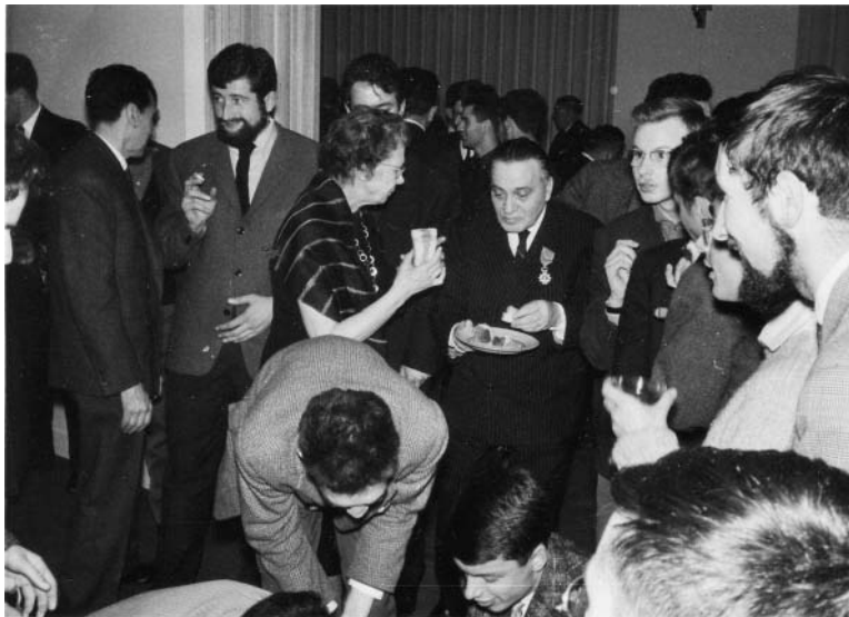
À l'issue de la cérémonie de remise de la rosette d'officier de la légion d'honneur à l'École normale supérieure.