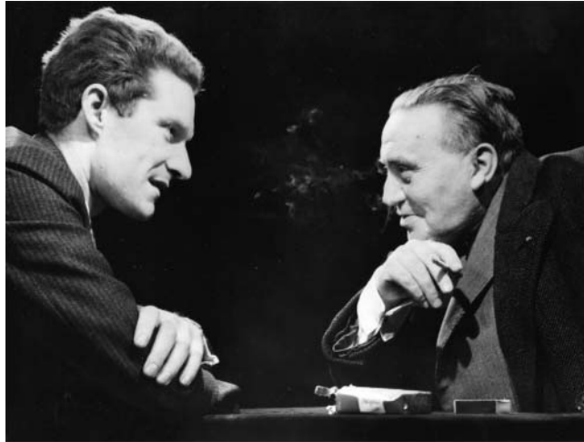
Entretien avec Alain Badiou lors des cours télévisés des années 1965-1966.

JEAN HYPPOLITE : Je pense que toute la philosophie que nous connaissons, depuis la philosophie des présocratiques, jusqu'à notre philosophie, jusqu'à Kant, marque un mouvement irréversible, va dans un sens irréversible comme le temps, comme le temps rempli, comme le temps plein, et cette irréversibilité fait qu'aujourd'hui la philosophie est une question pour elle-même, la métaphysique est une question pour elle-même. À partir de Kant, en particulier, il y a quelque chose qui s'est produit, et qui fait que la métaphysique n'est devenue que sa question : qu'est-ce que la métaphysique ? Il ne s'agit plus de faire une métaphysique, une théorie de l'être, ou une théologie, il s'agit de se demander, ce qu'est cette métaphysique et dans quelle mesure est-elle possible.