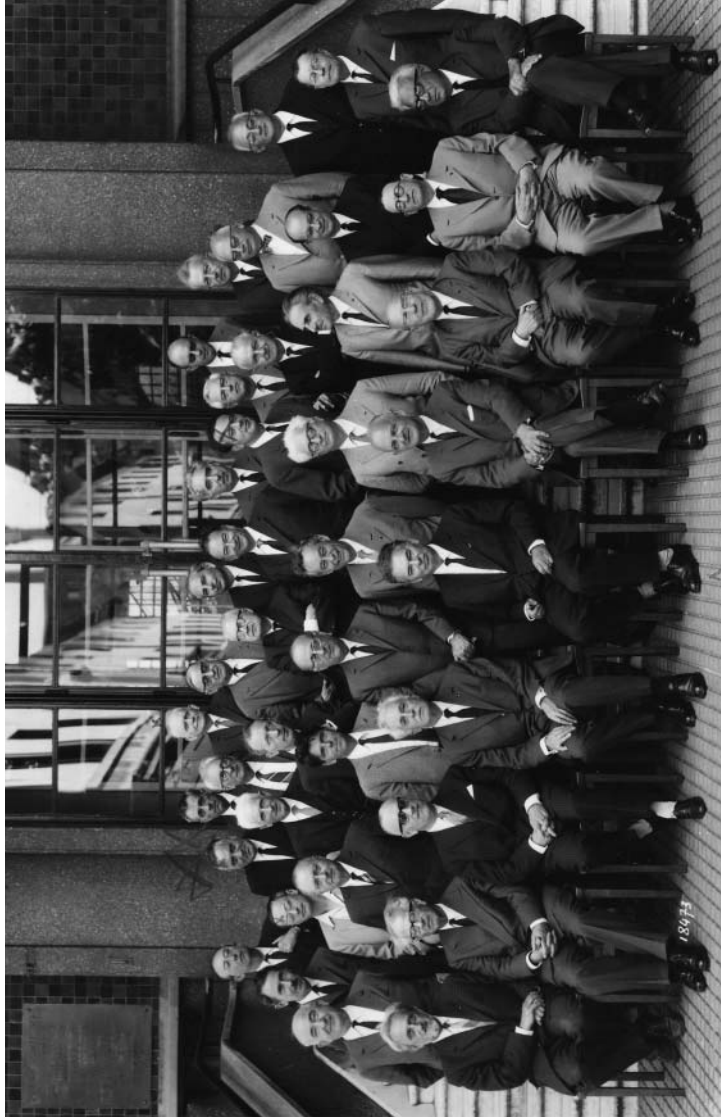
Collège de France, 1967.