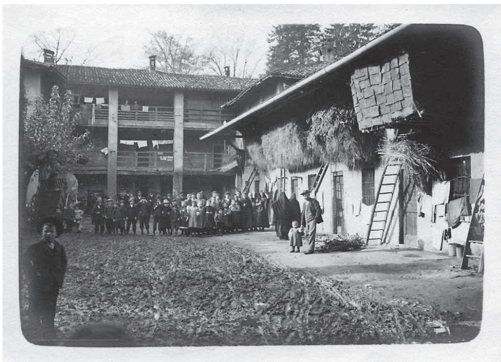
Fig. 2. Cortile in via Vittorio Emanuele a Usmate (già provincia di Milano), 1913. Al retro: «16-XI-913 / Usmate. Interno di una casa / Cortile. Ore 10 ½ ». Questa fotografia fa parte di una piccola serie scattata in occasione di un'escursione nel Vimercatese. Ritrae una corte rustica del centro di Usmate, facilmente riconoscibile e ancora oggi esistente, al civico 7 di Via Vittorio Emanuele, nonostante le pesanti alterazioni subite nel corso dell'ultimo secolo