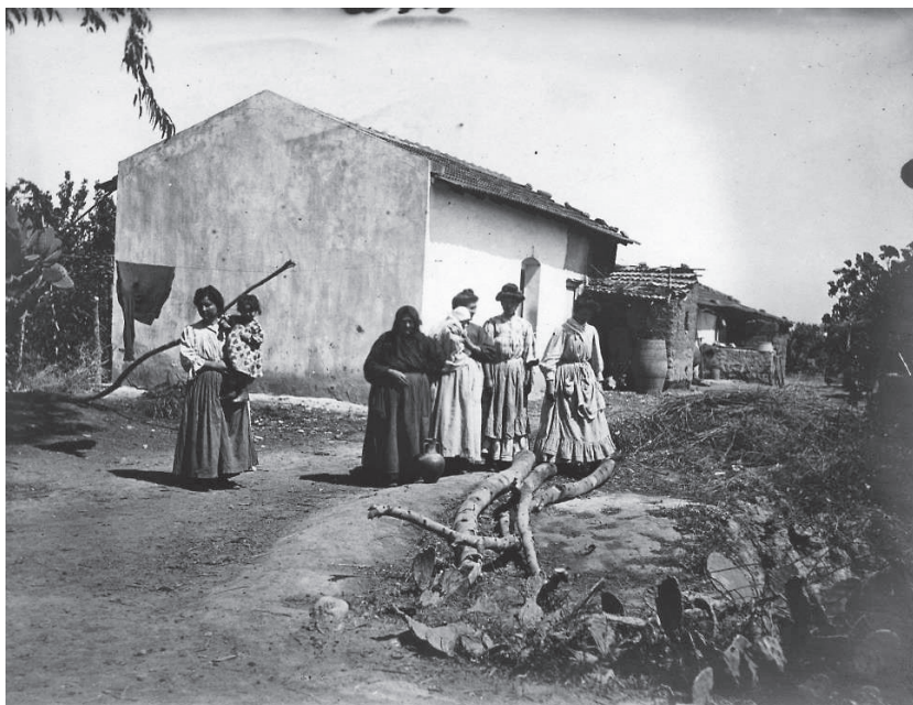
Fig. 1. Casa di contadini siciliani nei dintorni di Djedeida (Tunisia), 1910. Al retro: «Casa contadini siciliani presso Ge-deida / 7 maggio 1910 / (Olinto)». La fotografia, scattata da Olinto Marinelli nei pressi di Djedeida (cittadina tunisina posta all'incirca 25 km a ovest di Tunisi), fa parte della serie di immagini raccolte in occasione del viaggio in Sicilia e Tunisia compiuto nel maggio 1910 da O. Marinelli, U. Martinelli e L. Ricci Fonte: fondo fotografico del Gabinetto di Geografia, Università degli studi di Milano, biblioteca di Studi giuridici e umanistici