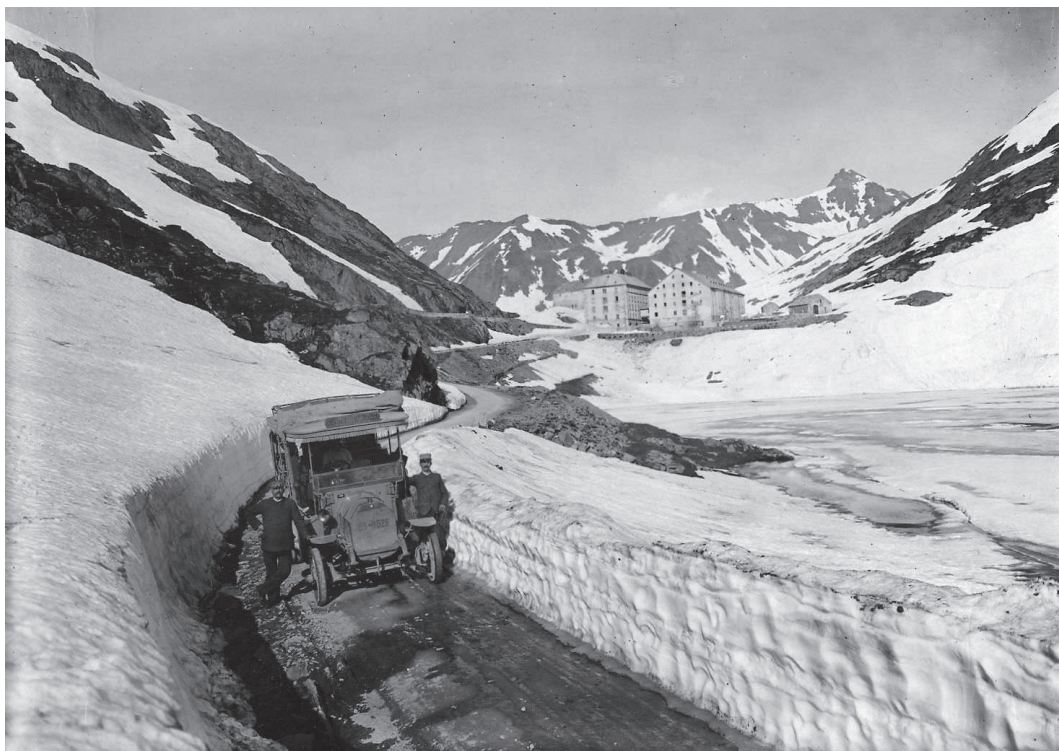
Fig. 5. Il Colle del Gran San Bernardo, anni Dieci. A lato, sul supporto di cartoncino: «Anneamenti» «Massa di neve ammucchiata dal vento / Gran S. Bernardo». Questa fotografia fa parte della serie di immagini su cartoncino ritraenti soggetti di carattere geomorfologico e glaciologico. La targa della corriera, in servizio sulla Aosta-Gran San Bernardo, consente di risalire all'immatricolazione della vettura, avvenuta nella provincia di Torino, verosimilmente nell'estate del 1909, offrendo un terminus post quem utile non solo a datare l'immagine, ma anche per eventuali riflessioni sulla collocazione temporale della più ampia serie a cui appartiene.