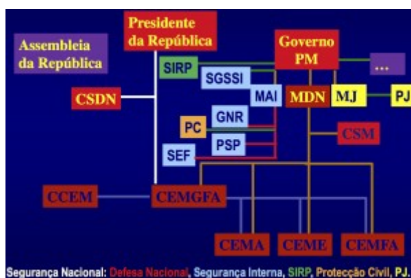
Struttura del sistema di sicurezza del Portogallo

Diversamente dai Carabinieri, la GNR non ricopre il ruolo di polizia militare, assegnato al Regimento de Lanceiros n. 2 (2° Reggimento Lancieri) o RL2, una unità dell'esercito portoghese responsabile per l'istruzione, l'organizzazione e la manutenzione delle unità operative della Polícia do Exército (Polizia dell'Esercito), senza essere una forza armata indipendente, né una forza di polizia.