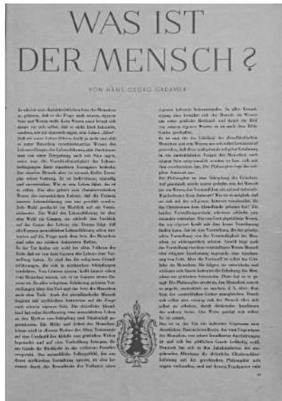
Image | Slika 2: Title page | Naslovna stran: Hans-Georg Gadamer: „Was ist der Mensch?“

Mit dem Beginn der Neuzeit hebt nun eine Bewegung an, die dieses Menschenbild aus griechisch-christlichem Geiste aufzulösen unternimmt. Sie nährt sich selbst aus abermals griechischen Ursprüngen. Wir nennen den