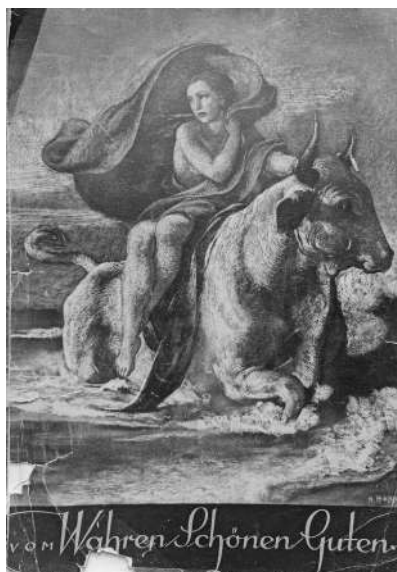
Image | Slika 3: Front cover | Naslovna platnica: Vom Wahren, Guten, Schönen (1947)

Unerwartetes und unmöglich Scheinendes zu entwerfen. Der geniale Mensch ist der Mensch der Eingebung, des schöpferischen Einfalls, der sich über das allgemeinmenschliche Maß unerreichbar erhebt. Dieser Mensch wird schöpferisch genannt, ein Wort, das erst im 18. Jahrhundert gebildet worden ist und seine Herkunft aus dem christlichen Begriff von Schöpfer und Schöpfung gänzlich vergessen hat. Man hat dieses Menschenbild den Homo faber genannt, den Menschen als Schmied, als Erfinder des Werkzeugs, dem alles, was ist, als