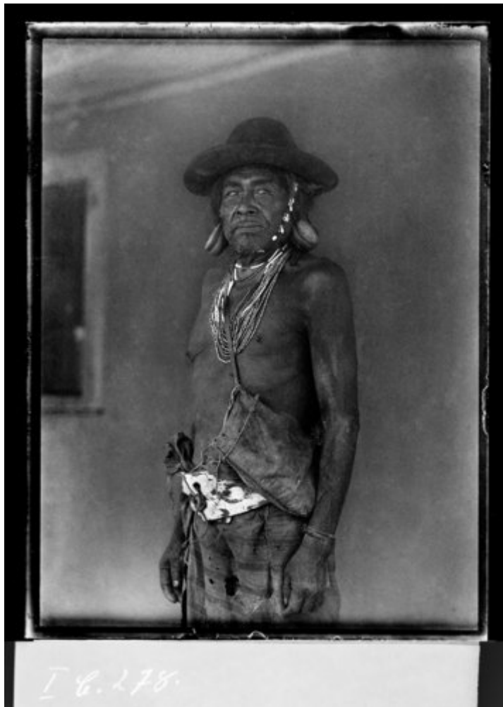
Fig. 6 - Anciano nivaclé (Esteros, 1935).

-uno de cuyos resultados sería un valioso estudio sobre las urnas funerarias guaraníes. Sin embargo, todavía habría de realizar una última y peculiar expedición etnográfica, muy diferente de sus viajes por el Mato Grosso.