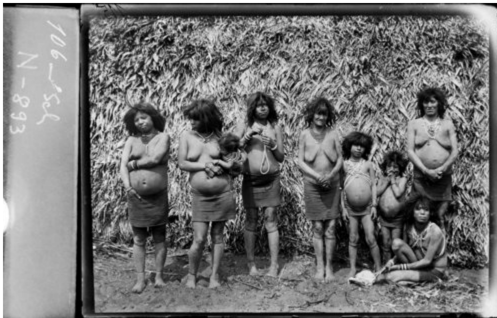
Fig. 3 – Mujeres y niñas kozarini-paresís (Uaririmi, 1910-1911).