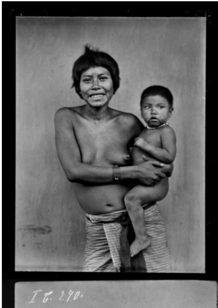
Fig. 10 - Mujer nivaclé con su niño (Esteros, 1935).

No extraña, entonces, que las páginas sobre los rituales indígenas, lejos de atisbar algún patrón simbólico subyacente, consistan en vívidas y minuciosas descripciones de acciones individuales impulsivas, desbordadas y desordenadas.