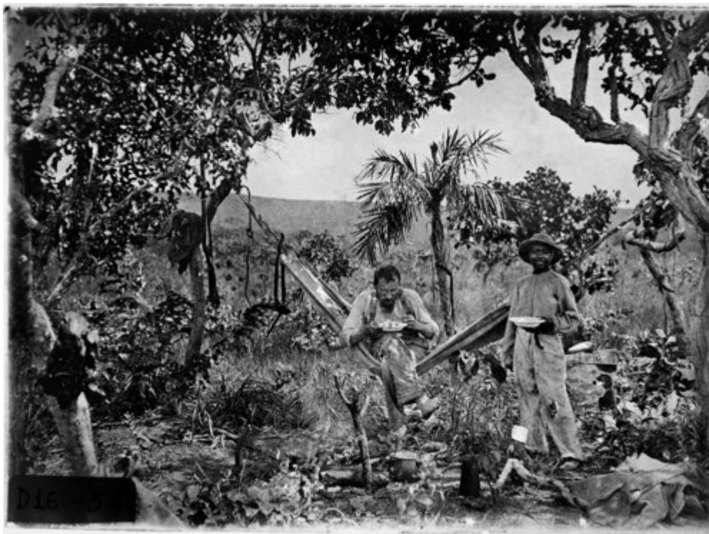
Fig. 1 – Max Schmidt durante su primer viaje al Mato Grosso (Río Novo, 1900).

En 1900, pocos meses después de haber abandonado una carrera de leyes y haberse enrolado en el Museo Etnológico, Max Schmidt se embarcaba hacia el Brasil siguiendo