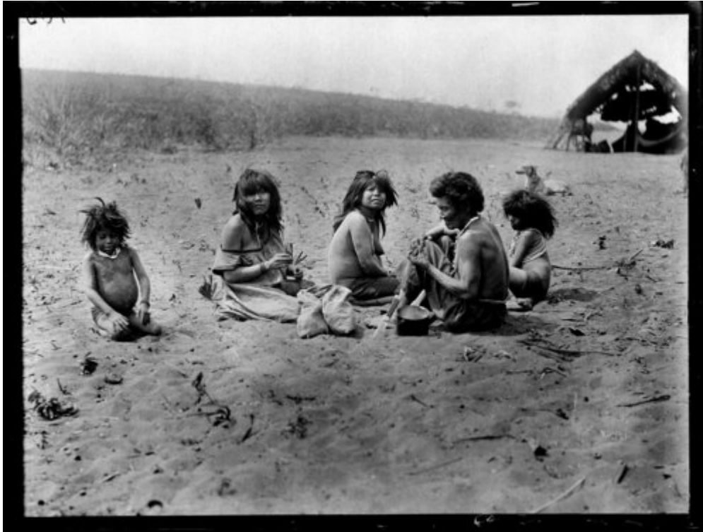
Fig. 5 - Mujer kozarini-paresí con sus hijos (Uaririmi, 1910-1911).