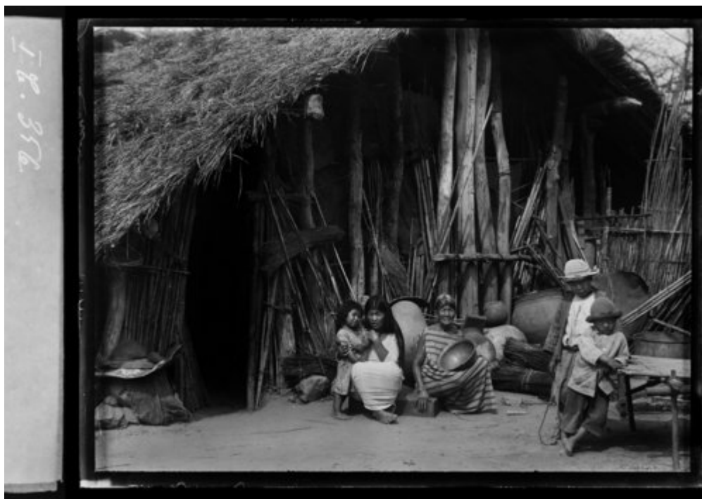
Fig. 8 - Mujeres y niños chiriguano (Machareti, 1935).

siguiendo a Métraux, supuso absorbidas por las mujeres en el proceso de mestizaje con los chanés pedemontanos. En efecto, siguiendo la tesis canónica de Nordenskiöld y Métraux sugirió que sociedades como los chiriguanos, los isoseños o los chanés son productos históricamente situados de diversas oleadas de mestizaje entre grupos tupí-guaraní y arawak: “Los Chiriguanos y los Chanés forman al presente una entidad de cultura que se puede significar como cultura de los Chiriguanos, porque la lengua Guaraní de los Chiriguanos llegó a ser la lengua común de todo el grupo. También los Izozós pertenecen a esta entidad étnica. Así que hay que considerar a esta entidad como formada por tribus completamente diferentes. También hay que concebir su cultura como el producto de la fusión de elementos culturales muy heterogéneos” [100].