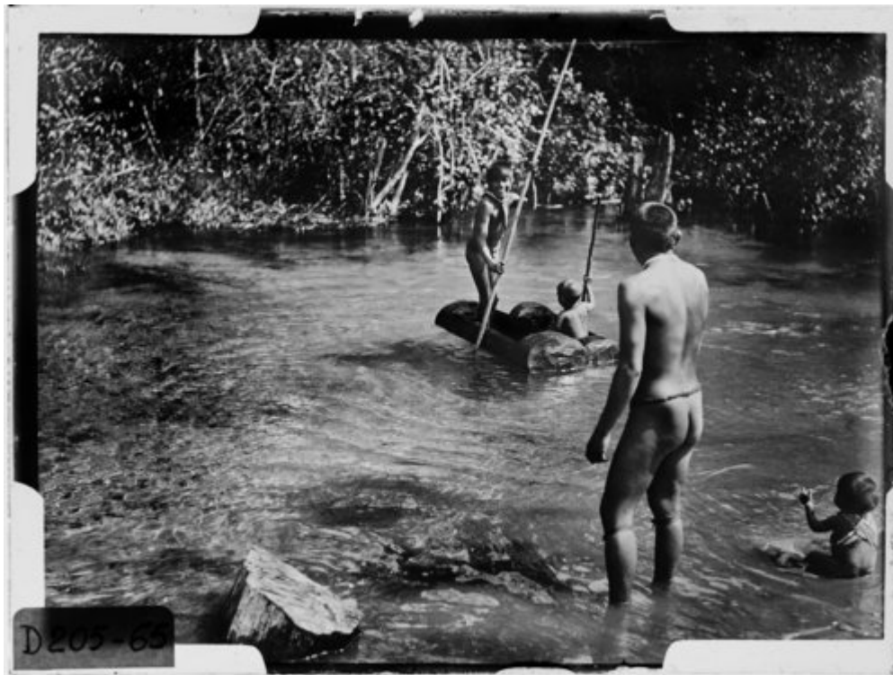
Fig. 4 – Niños kozarini–paresís navegando (Uazirimi, 1910–1911).

un año después director de la sección latinoamericana del Museo de Etnología. Hasta 1926 siguió dedicándose a investigaciones de corte más teórico y comparativo, interesándose particularmente por problemas de cultura material –su material de trabajo cotidiano era, recordémoslo, las amplias colecciones del museo. Sin embargo, acaso cediendo a la nostalgia de la soledad en la selva, constantemente se retiraba a casas campestres para trabajar tranquilo [77].