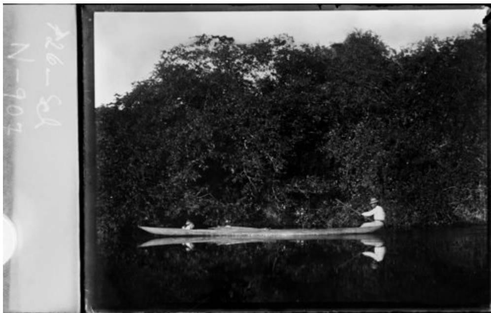
Fig. 2 – Canoa guató (Río Caracará, 1910–1911).

indígenas utilizaban en sus plantaciones [56]. Luego, remontando aún más el Paraguay, se adentró en territorio de una parcialidad paresí (auto-designados “kozarinis” aunque también conocidos como “kabichis”), “que vivían allí todavía en estado primitivo e independiente” [57]. Las fotos kozarinis que aquí publicamos proceden de este viaje, e ilustran bien las características físicas que impresionaban a los viajeros: el torso musculoso, las piernas delgadas y combadas –producto, según cree Schmidt, de vivir casi todo el año surcando las tierras anegadas en canoa [58].