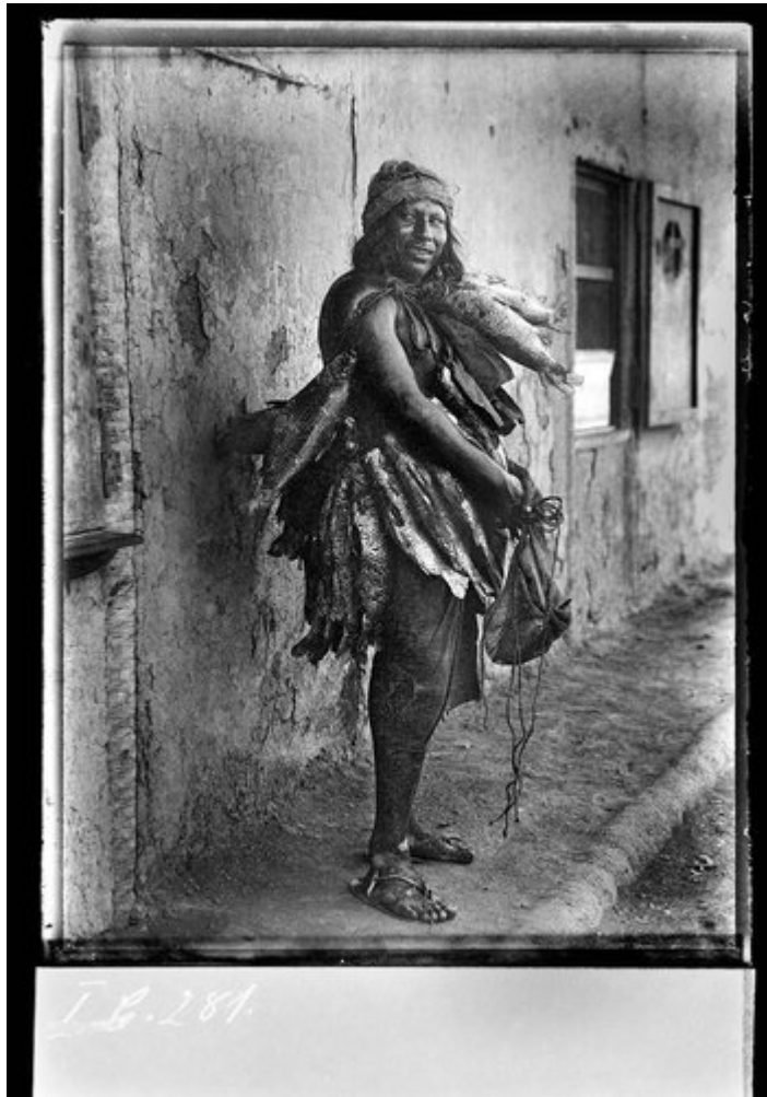
Fig. 9 – Pescador nivaclé (Laguna Escalante, 1935).

“Durante mi estadía entre los indios guató, una mujer –en una imitación inconsciente de la pregunta homérica τίς ποθεν εἰς ἀνδρῶν– quería saber desde dónde había llegado. Su pregunta fue ‘ Diruadé iókaguahe nitoavi? ’ (¿Cómo son las cosas en tus tierras?). Luego preguntó: ‘¿Hay mucha gente en tu tierra? ¿Hay muchas casas allí?’. Su pregunta sobre la duración de mi viaje fue: ‘¿Estaba grande el río cuando viajaste?’ ¿Estaba tu camino libre de maleza?’. Incluso estas pocas palabras nos permiten dar un vistazo a la vida de estos guatós, y revelan cuán profundamente el río participa de sus pensamientos” [111].