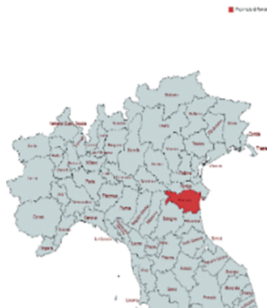
Figura 2 – Mappa delle province italiane del nord Italia (creata tramite MapChart, 2023). In rosso è evidenziata la provincia di Ferrara

Data tale situazione sociolinguistica, potremmo ipotizzare che nei parlanti biletali italo-ferraresi (e soprattutto nelle generazioni più giovani o con alto livello di istruzione), l'italiano sia di frequente la lingua dominante ed eserciti pressione sulla grammatica dialettale, che tenderebbe ad una perdita dei tratti locali a favore di quelli neo-standard 4 . Tuttavia, tenendo conto delle proprietà dei repertori intermedi (dall'inglese intermediate speech repertoires , cfr. Auer 2000) attestati sia a livello italiano che europeo (si veda Cerruti et al. 2017 per il contesto italiano), un'ulteriore possibilità consisterebbe nell'emergenza di tratti propri del dialetto locale nella varietà di italiano parlato in questa provincia, interessante da indagare principalmente per due ragioni. In primo luogo, perché il dialetto ferrarese è una varietà poco indagata, nonostante la sua collocazione all'estremo est della zona gallo-italica. In secondo luogo, per quanto concerne l'espressione dell'indefinitezza, perché i dialetti gallo-italici presentano una comune tendenza all'estensione dell'uso del determinante di+ART rispetto all'italiano colloquiale (come visto nel paragrafo 2). Pertanto, in questo