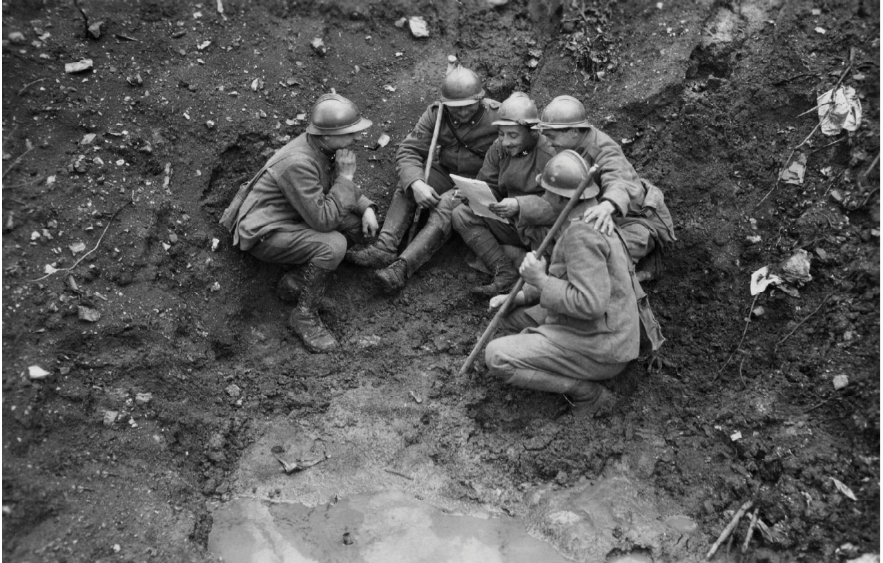
Luigi Marzocchi, n. 867, Nel cratere di una granata. Nuove canzonette