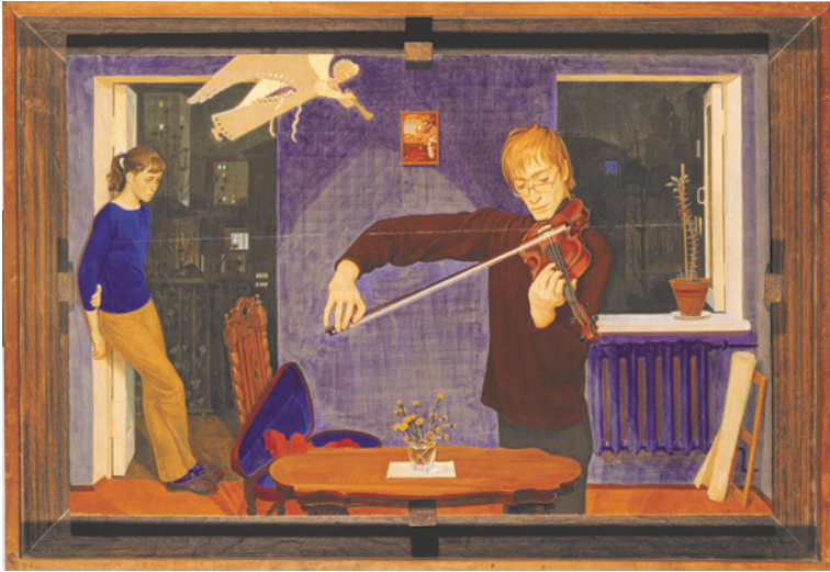
Figura 4 Dmitrij Žilinskij, Il violinista , 1972. Tempera su tavola, cm 45 × 73,5. Galleria Tret'jakov, Mosca.

lettura dell'opera sembrerebbe quindi abbastanza chiara. Tuttavia, in base a quanto scritto da Tornabuoni, si scopre che il dipinto presenta contenuto simbolico: