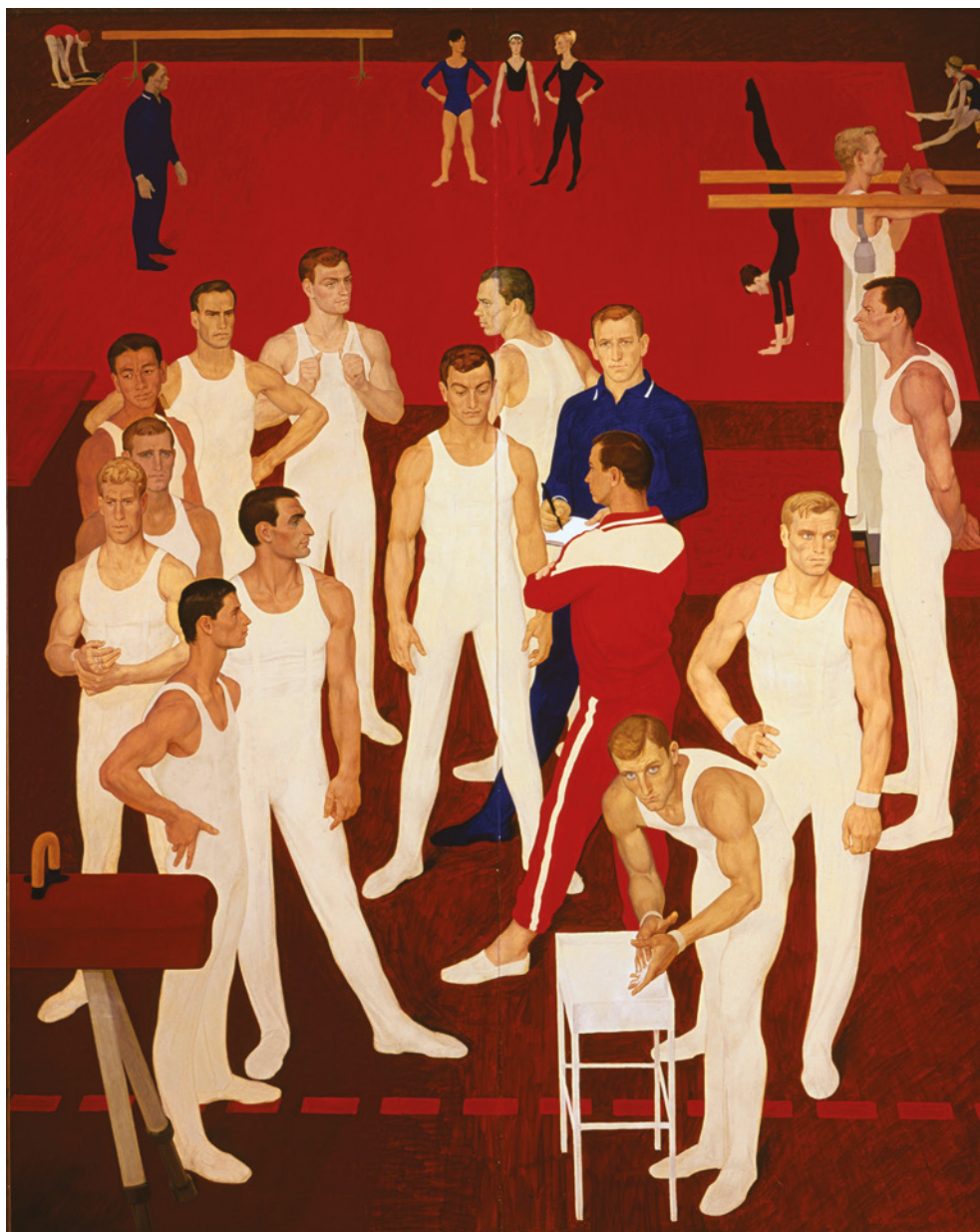
Figura 2 Dmitrij Žilinskij, I ginnasti dell'Urss . 1965. Tempera su tavola, cm 270 × 215. San Pietroburgo, Museo Russo.