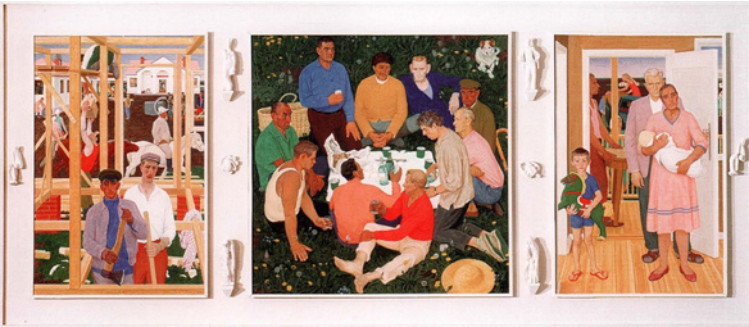
Figura 3 Dmitrij Žilinskij, Nelle nuove terre . 1967. Tempera su tavola, cm 151 × 351,5. Galleria Tret'jakov, Mosca

ta l'opera, aspettava ben uno o due mesi prima di passare la vernice finale. L'idea di attendere a lungo derivava dalla lettura del trattato trecentesco Il Libro dell'arte di Cennino Cennini (cf. Podšivalov 2012a; D'jakonicyna 2017, 18), nel quale l'autore consiglia, addirittura, di aspettare per almeno un anno. Il senso di quest'attesa risiede nel fatto che, se la tempera viene trattata con la vernice finale quando è completamente essiccata, i colori si accendono, altrimenti si producono cadute di tono che determinano l'incurimento dell'opera (Cennini, Il libro dell'arte , cap. CLV). Infine, per dare maggiore risalto ad alcuni dettagli dei visi dei personaggi, Žilinskij era solito ripassarli con colori a olio (Podšivalov 2012a).