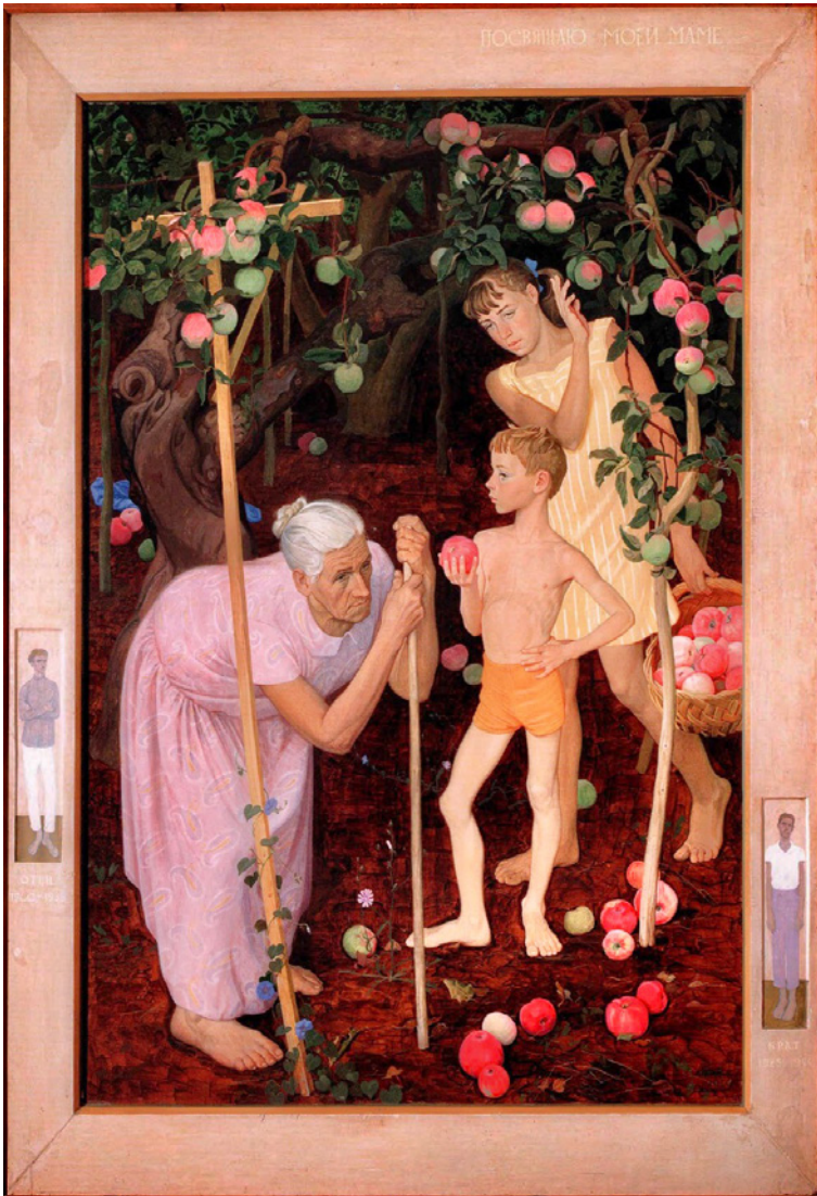
Figura 6 Dmitrij Žilinskij, Sotto il vecchio melo . 1969. Tempera su tavola, 202 x 140 cm. San Pietroburgo, Museo Russo