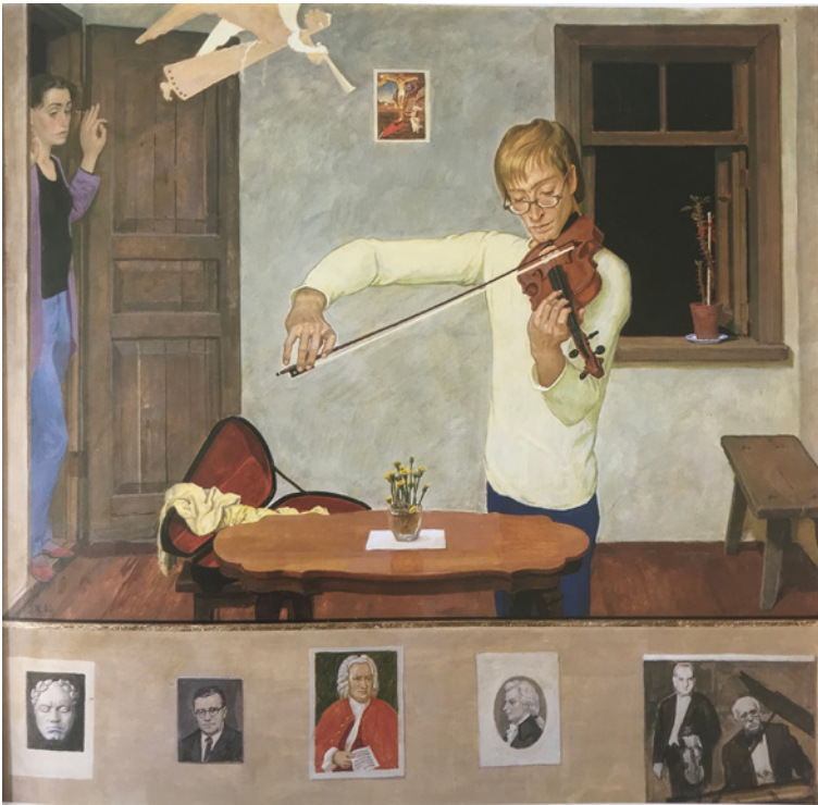
Figura 5 Dmitrij Žilinskij, Il violinista . 1986. Tempera su tavola, cm 71,5 x 74. Collocazione sconosciuta.

madre dell'artista e il vecchio melo sono in rapporto di analogia poiché ambedue, nonostante il passare degli anni, sono ancora fertili: il primo produce frutti, la seconda una discendenza, ossia i nipoti; come il melo nel corso della sua vita ha perso dei rami che si sono seccati, così la madre ha perduto il marito e un figlio; infine, il tema dell'opera viene identificato con quello dell'albero della vita, inteso come simbolo del ciclo della stessa. 34 Quest'interpretazione ha il difetto di fermarsi a una lettura superficiale, poiché tralascia l'analisi di diversi elementi della composizione. Lebedeva (2001, 29) è l'unica che ha tentato di spingersi oltre, riconoscendo nel palo di sinistra, che regge i rami, un riferimento alla croce e identificando il figlio di Žilinskij, con la mela in mano, come un giovane Adamo. Tuttavia, per quanto queste intuizioni fossero promettenti, ella si è limitata a leggere tutta la scena come un discorso sulla vita e sulla sofferenza. Come ab-