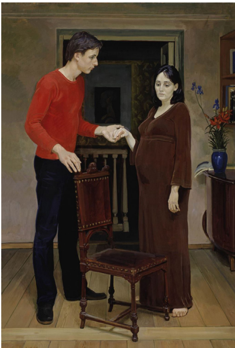
Figura 7 Dmitrij Žilinskij, La giovane famiglia . 1980. Tempera su tavola, cm 70 × 47. Mosca, Galleria Tret'jakov