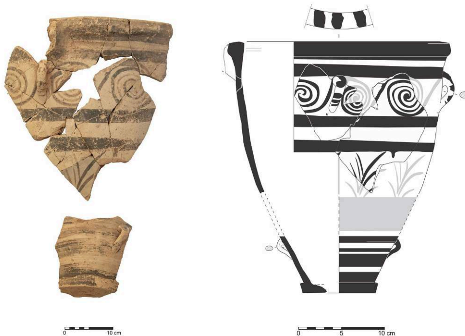
Fig. 4. Grande jarre à bec ponté à décor de spirales et roseaux (P5055 ; P5058 ; P5063 ; P5064 ; P5065 ; P5066) datée du Minoen Récent IA provenant de la pièce 2 de la Maison C.