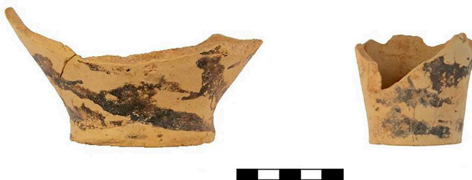
Fig. 2. Jarre (P5016 ; P5036) et gobelet tronconique (P5041) à décor d'éclaboussures ( Spatter Ware ) datés du Minoen Moyen IB provenant de la pièce 2 de la Maison C.