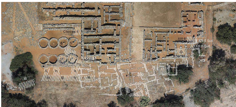
Fig. 5. Vue aérienne de la partie sud du Palais de Malia, avec la localisation des sondages menés par Olivier Pelon.

© EFA/M. Devolder, d'après la photographie aérienne de L. Fadin, N1278-03-9649.