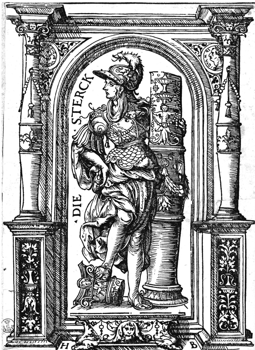
FIG. 3 – Hans Burgkmair il Vecchio, La Fortezza , 1510 ca. Firenze, Gabinetto dei Disegni e delle Stampe degli Uffizi, 10322 st. sc.