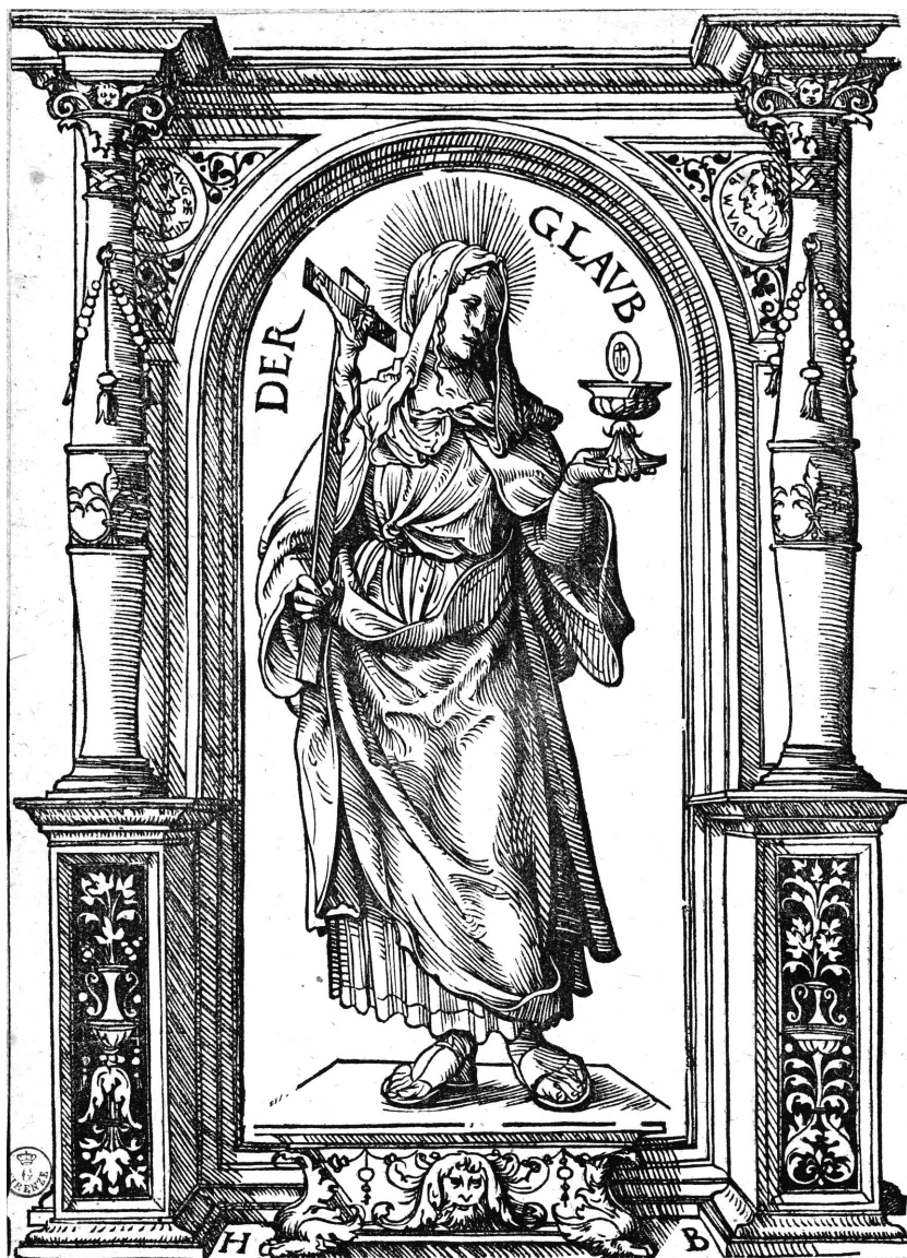
FIG. 2 – Hans Burgkmair il Vecchio, La Fede , 1510 ca. Firenze, Gabinetto dei Disegni e delle Stampe degli Uffizi, 10322 st. sc.