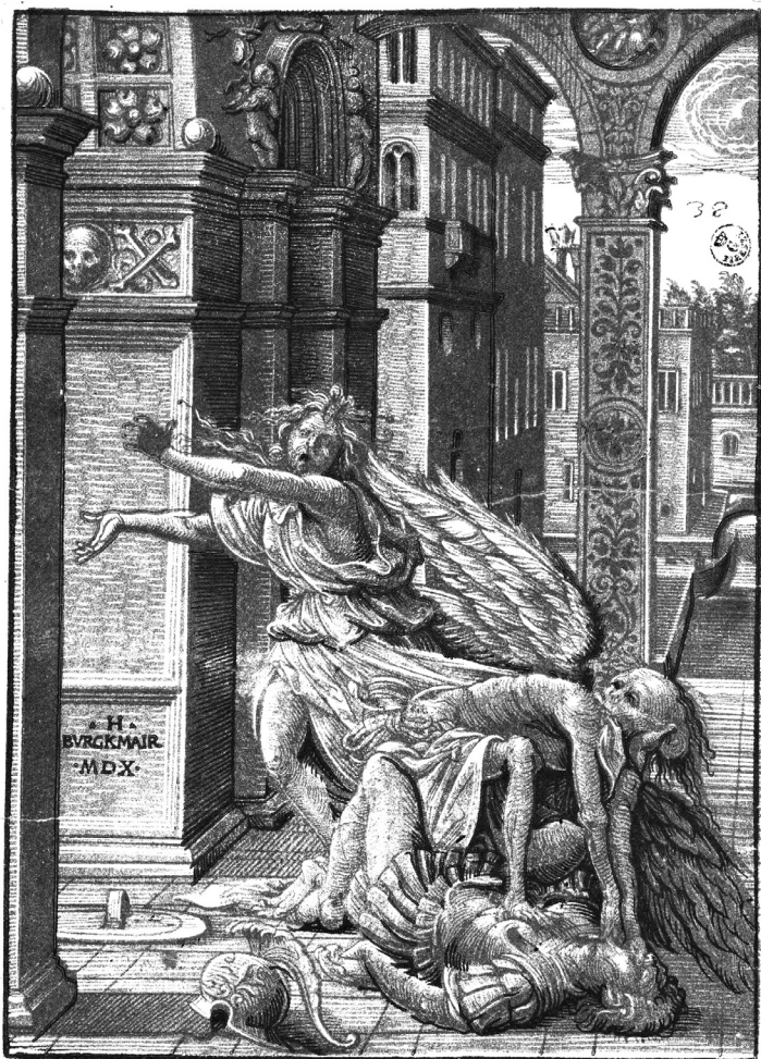
FIG. 1 – Hans Burgkmair il Vecchio, Gli amanti sorpresi dalla Morte , 1510. Firenze, Gabinetto dei Disegni e delle Stampe degli Uffizi, 10322 st. sc.