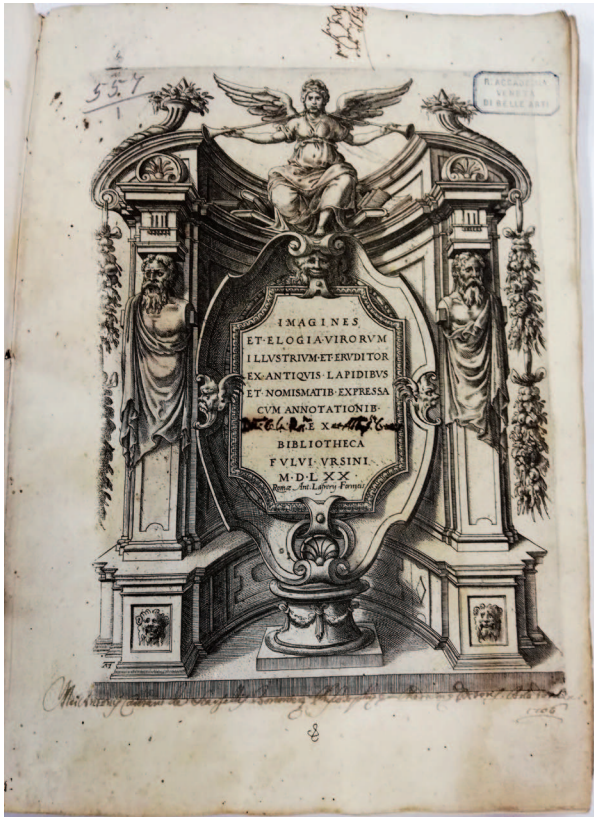
1. Frontespizio calcografico realizzato da Andrea Marelli per il libro Imagines et elogia virorum illustrium et eruditor. ex antiquis lapidibus et nomismatib. expressa cum annotationib. Ex bibliotheca Fulvi Vrsini , edizione del 1570, collocato in F. ST. D 3 e proveniente dalla biblioteca di Apostolo Zeno.