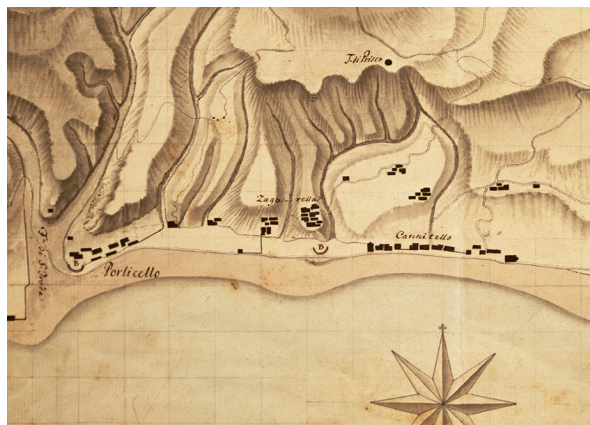
Fig. 2 - Stralcio territorio di Cannitello - Porticello 1812, con indicazione T. di Prisco

Esisteva in passato anche una terza Torre, detta il Torrione o Torre di Pirgo , risalente ad epoca molto remota per quanto rimanga ignota la sua origine. Essa, già malandata e scossa dal tempo, cadde definitivamente sul finire dell'Ottocento 67 , ma anche in questo caso si trattava di una costruzione con una diversa struttura architettonica non identificabile con Columna Regia , per due motivi fondamentali. Si trattava, come la sua denominazione Torrione rendeva evidente, di una massiccia Torre a pianta quadrangolare 68 del tutto inconferente con l'esile Torre di Columna; era lontana dal mare circa 1 km, collocata sulle alture collinari sopra l'abitato di Cannitello in località Pirgo e perciò inadatta a svolgere la funzione di riferimento portuale. È riportata in una pianta planimetrica del 1812 sotto la denominazione T.(orre) di Prisco (fig. 2), cioè risalente a tempi assai remoti 69 .