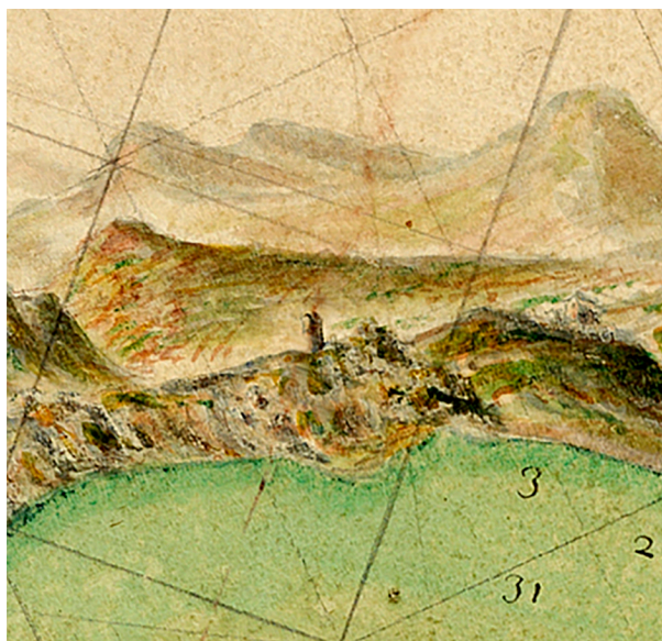
Fig. 1 - Columna in rilievo del 1702 (particolare)

posizione nel più vasto fenomeno del Cenideo costituito estensivamente da quell'estrema parte di territorio calabrese prospiciente il Faro di Messina tra Punta del Cavallo e Coda della Volpe (Pezzo-Fossa di Cannitello), luoghi di privilegiata importanza mercantile marittima.