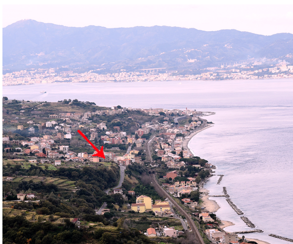
Fig. 5 - Promontorio P. della Torre dove sorgeva la Columna

insediamento edilizio di epoca più antica, contraddistinto da piccole costruzioni edificate con maudo 75 di cui residuano ancor oggi ruderi in significativa quantità. Va ancora precisato che tale promontorio, oggi interessato in parte dalla costruzione di moderni edifici, a causa dei lavori per la costruzione della litoranea provinciale verso Scilla realizzata dai Borbone intorno al 1825-26 76 , fu oggetto di sbancamenti che hanno determinato la sezione e l'asporto di parte cospicua del promontorio come si ricava visibilmente, e con esso forse degli eventuali ruderi della Torre sopravvissuti al terremoto del 1783 (fig. 5).