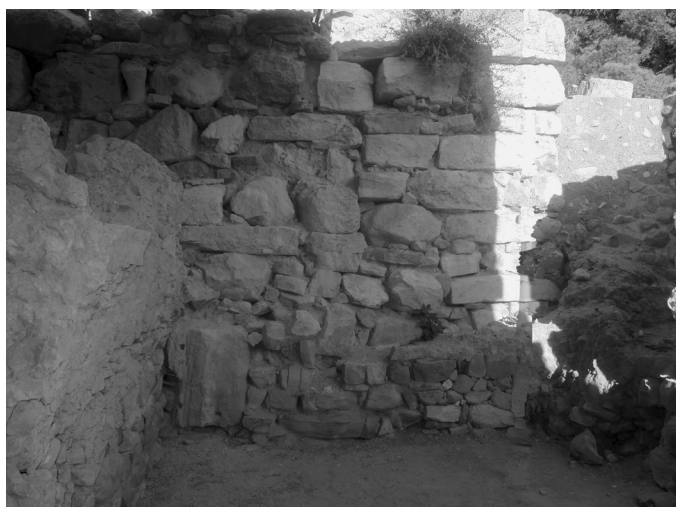
FIG. 3 – VEDUTA DA EST (DAL PASSAGGIO TRA LX E LXIV) DEL VANO LXIV: A SINISTRA IL MURO NORD, CHE SEPARA IL VANO LXIV CON IL VANO LVIIIe, FRONTALMENTE IL MURO EST, A DESTRA IL MURO SUD.

Il vano LXIV ha forma quadrangolare ed è in linea con i due precedenti ambienti LIX e LX ma è posto poco più a sud. Esso è delimitato a nord da un grosso muro, che coincide con la parete sud del vano LVIIIe, a est da una parete meno conservata intercettata dagli antemurali del Secondo Palazzo, presenti anche sopra la muratura meridionale, e a ovest dal limite orientale del muro meridionale del vano LX ( fig. 3 ).