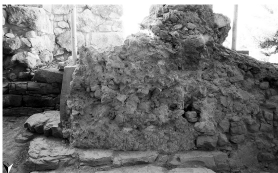
FIG. 8 – DA SINISTRA A DESTRA: L'ESTREMITÀ OCCIDENTALE DEL VANO LXIV; LE LASTRE CALCAREE SOTTO IL MURO NELL'AREA DELLA ZONA DI PASSAGGIO TRA LX E LXIV; IL MURO SUD DI LX.

3) Il muro sud (lunghezza: 3,55 m) (fig. 7).