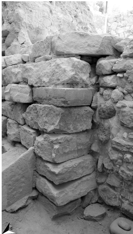
FIG. 5B – I FILARI DI LASTRE CHE FORMANO IL PASSAGGIO TRA I MAGAZZINI LVIII E I VANO LX E LXIV DA NORD-OVEST (DAL VANO LVIIIc). A DESTRA IL MURO SUD DEL VANO LVIIIc.

Di seguito sono riportate alcune osservazioni relative alle strutture del vano LXIV.