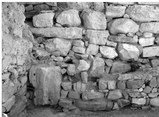
FIG. 6 – IL MURO EST DI LXIV DA OVEST (DAL PASSAGGIO TRA LX E LXIV). DA SINISTRA A DESTRA: L'ORTOSTATE NELL'ANGOLO NORD ORIENTALE DELLA PARETE; LE LASTRE DI CALCARE GRIGIO; PIETRE DISPOSTE IN MANIERA IRREGOLARE. DIETRO IL MURO SONO VISIBILI LE SOSTRUZIONI DEL SECONDO PALAZZO.

presenti sotto le lastre che formano il passaggio dal vano LX a LXIV e distinguibili dal vano LVIIIc (figg. 5a-5b) 38 .