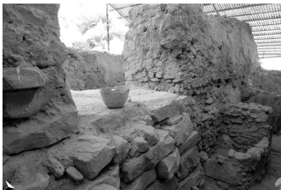
FIG. 5A – IL MURO SUD DEI MAGAZZINI LVIII. SOTTO IL VASO SONO VISIBILI LE LASTRE DI CALCARE GRIGIO IMPIEGATE SIA NELLA PARETE SUD DI LVIII E SIA PER LA COSTRUZIONE DEL PASSAGGIO TRA LX E LXIV.