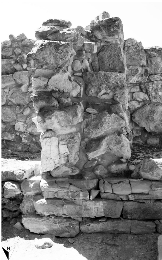
FIG. 7 – IL MURO SUD DI LXIV DA NORD: I FILARI ORIZZONTALI DI LASTRE DI CALCARE GRIGIO ALLA BASE DEL MURO NORD DI 98W DEL SECONDO PALAZZO NORD (FOTO DELL'AUTRICE).