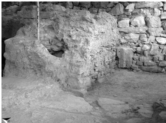
FIG. 4 – IL MURO NORD DI LXIV DA SUD-OVEST (DAL VANO LX). DAL BASSO ALL'ALTO: I FILARI DI LASTRE IN CALCARE GRIGIO; IL NUCLEO MURARIO; ALL'ESTREMITÀ SINISTRA I GROSSI BLOCCHI RICONOSCIUTI COME PARTE DI UNA RAMPA.