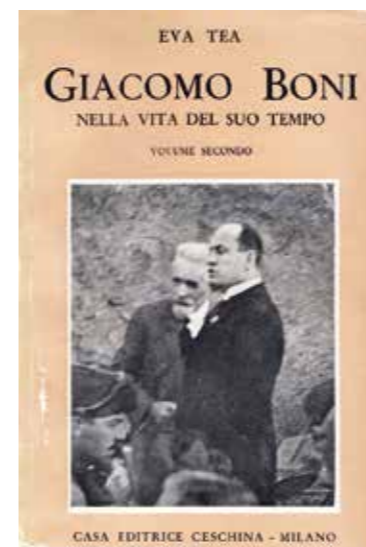
Fig. 2 a-b