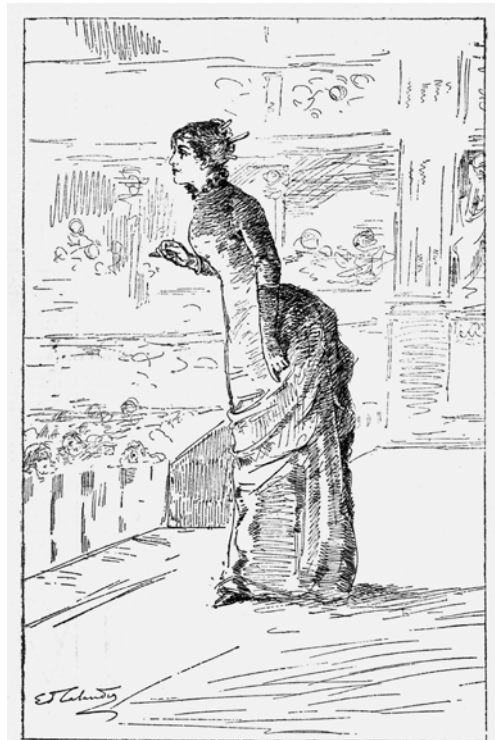
Recitato per la prima volta al Teatro Carignano in Torino dalla Sig. na ELEONORA DUSE-CHECCHI la sera del 19 gennaio 1883