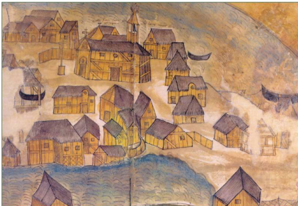
Fig. 2 | “Venezia in legno”, disegno del XVI secolo (ma probabilmente copia di un disegno medievale più antico), sito non ricostruibile con esattezza, ma collocabile nella laguna nord (Tomaso Diplovatacio, Tractatus de Venetae urbis libertate , Biblioteca Nazionale Marciana, mss. lat. XIV, n.77, cc. 22v-23r).

La Venezia delle origini non era una città di pietra, né di mattoni. Era di fango e di legno (Fig. 2). Il mito delle origini sottende una sorta di fondazione, immaginando la città da subito come monumentale. Pur nella difficoltà, Venezia avrebbe eretto i suoi monumenti, costruiti con materiali durevoli. L’archeologia ha in qualche modo avuto un ruolo nel rinforzare questa idea. Attraverso i resti archeologici rinvenuti e studiati, esposti nei musei, o attraverso le analisi delle pietre antiche conservate nelle murature della città moderna, ci si è concentrati nello studio delle reliquie solide del passato. Abbiamo studiato le pietre e le iscrizioni, che potrebbero definirsi eccezioni nel panorama urbanistico veneziano. Minore attenzione è stata riservata alle buche di palo delle case e alle rive in legno, che meglio descrivono il carattere anfibio, mutevole e precipuo della Venezia delle origini.