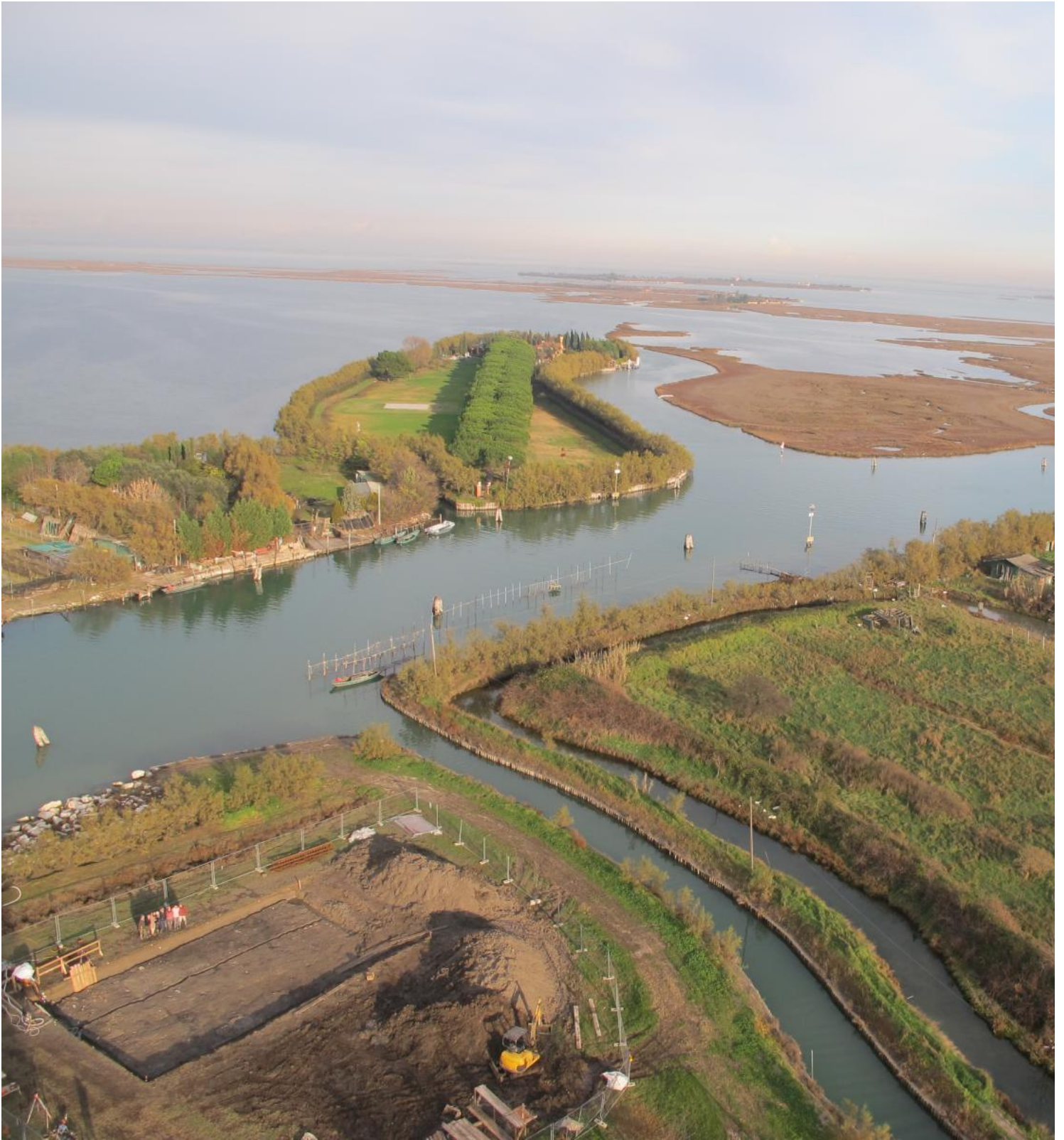
Fig. 1 | Torcello, Vista dal Campanile con gli scavi dell'Università Ca' Foscari, Venezia, Progetto Torcello Abitata, 2012-13.

Dialogare intorno alle origini di Venezia, interrogandosi sulle forme e sul possibile rapporto tra costruito/non-costruito, o meglio pieno/vuoto, negli spazi proto-urbani lagunari, ci impone di considerare dati storici e archeologici noti, ma anche (e soprattutto) la sua complessa storiografia. Tentare di comprendere i caratteri della Venezia nascente, infatti, significa interrogarsi sulle dinamiche che hanno portato alla nascita di un sito che possiamo definire vincente nel medioevo europeo (McCormick 2001), e allo stesso tempo ci impone la discussione circa le eredità di una potente narrativa di stato, 'fabbricata' ad uso celebrativo della Serenissima (Fasoli 1958; Cruzet Pavan 2001; Ortalli 2008; Calaon 2014a; Calaon 2014b; Calaon 2014c).