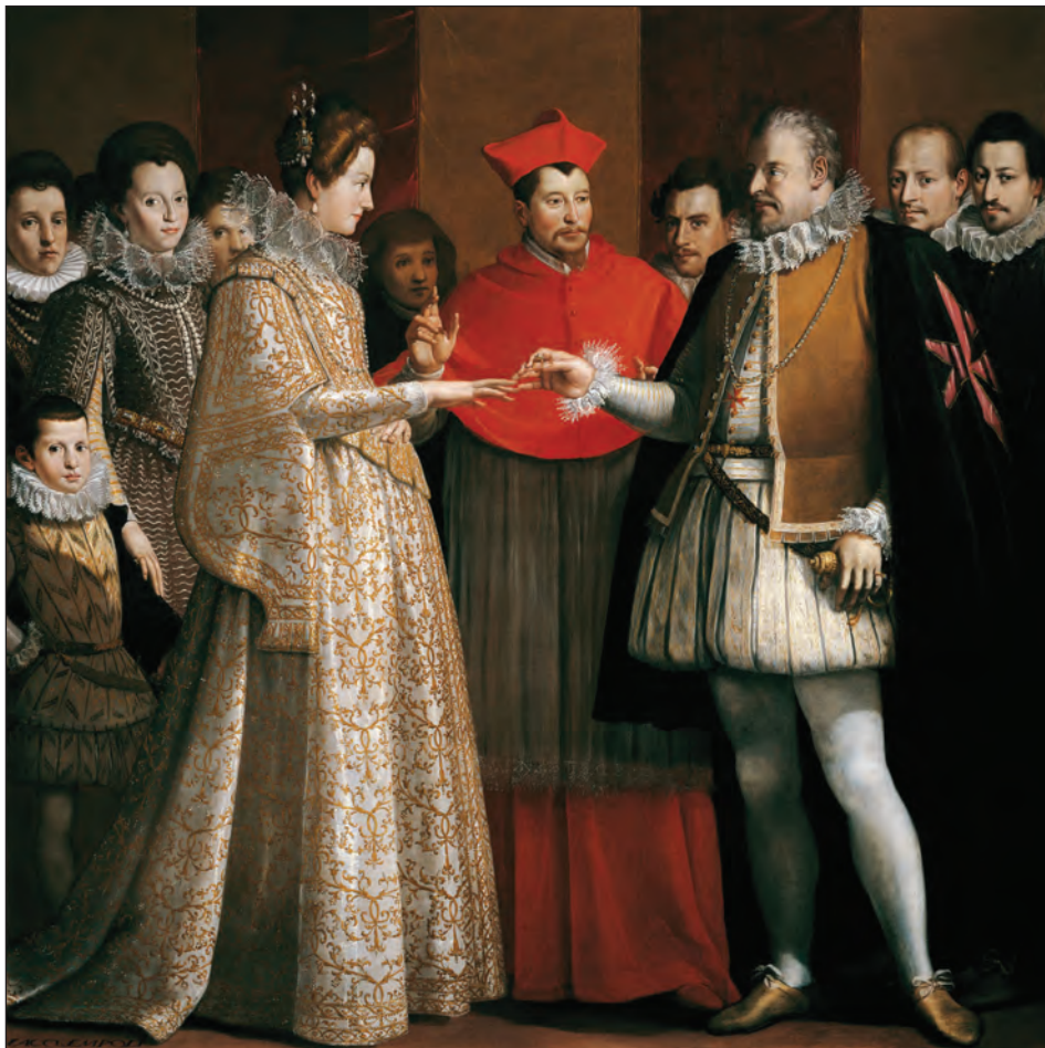
Fig. 8: Wedding of Maria de Medici and Henry IV of France. Jacopo da Empoli (1600) ( https://commons.wikimedia.org/wiki/File:Marie_de_Medici%27s_marriage.jpg ).