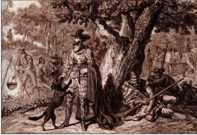
Figure 1: Serrallonga