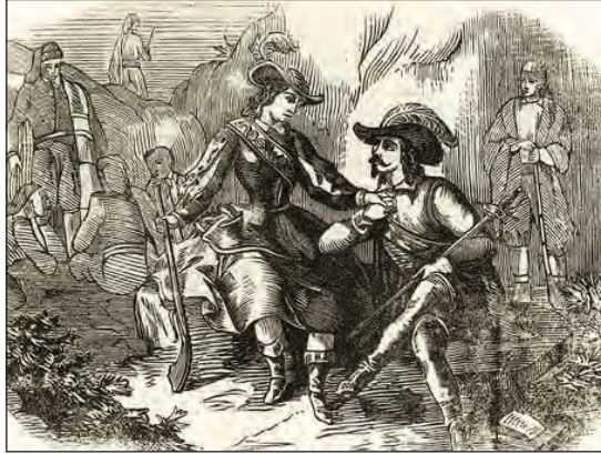
Figure 2: Perot Rocaguinarda