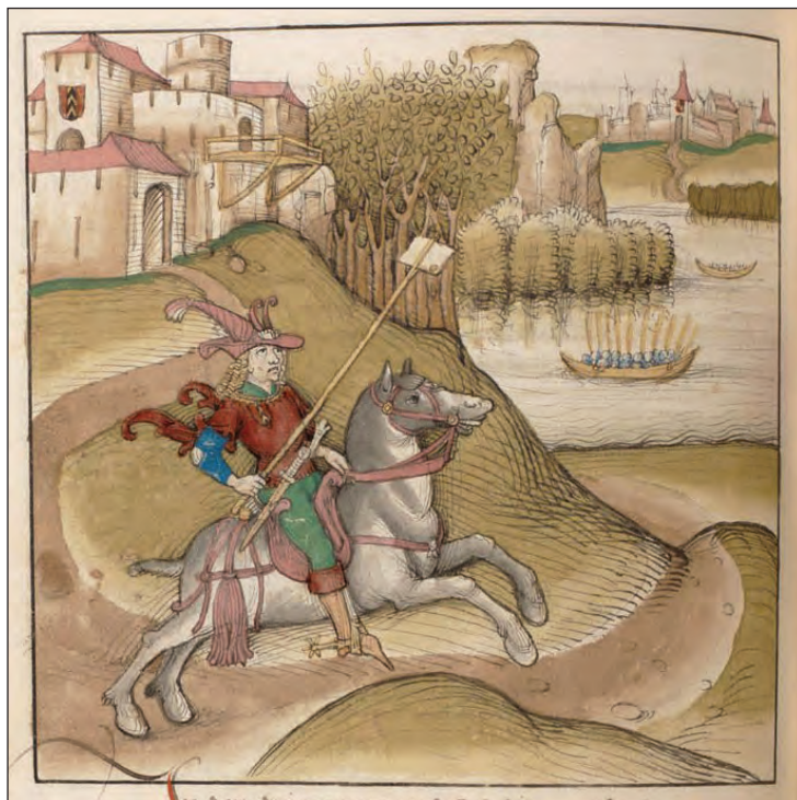
Fig. 3: Count Gerhard Aaberg-Valangin sends the city of Bern a written declaration of enmity or Fehdebrief . Speizer Chronik des Diebold Schilling , 1339

act honourably. The parties to a conflict had to know what response could be expected for their words, gestures, or other actions, so they (and the community) could act accordingly: those threatened with violence had to expect violence. Consequently the line between a threat with enmity and the declaration of enmity could be blurred (Boehm, 1993, 92–94; Miller, 1996, 54; Mommertz, 2001, 218–223).