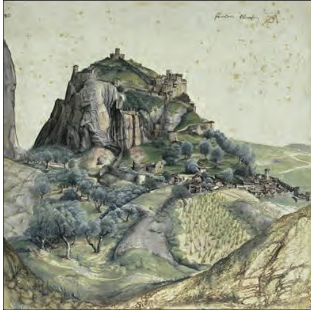
Immagine 1: Castello D'Arco (Albrecht Dürer, 1495)

dell'aristocrazia locale e giuristi nominati ad hoc ), che agiscono di concerto con la dieta territoriale della contea, il Landtag , e infine, nel 1507, al Reichskammergericht di Spira, il Tribunale camerale dell'impero, presso il quale verrà nominata un'ultima commissione presieduta dal cardinale Adriano Castellesi di Corneto, che nel 1512 risolverà la contesa separando in due parti ben distinte il possesso del feudo tra i fratelli 14 .