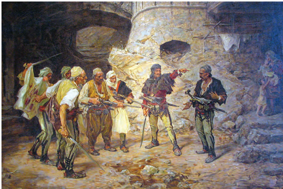
Fig. 2: Banishment (variant) . Pavle Paja Jovanović, ca. 1890–1900. Narodni muzej, Beograd ( https://upload.wikimedia.org/wikipedia/sr/d/d0/Jovanovic_izdajica.jpg )

taken as part of it. The definition of vengeance as a legal custom is also too narrow, as the custom establishes and reflects all relations comprising society, from the political to the economic.