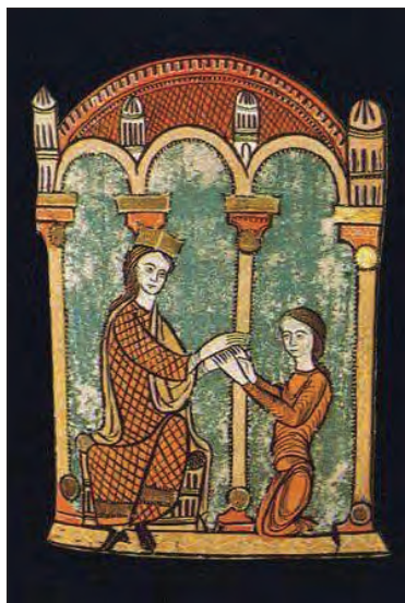
Fig. 4: Ramón Berenguer IV receives homage from his vassal the Señor de Perelada in 1132