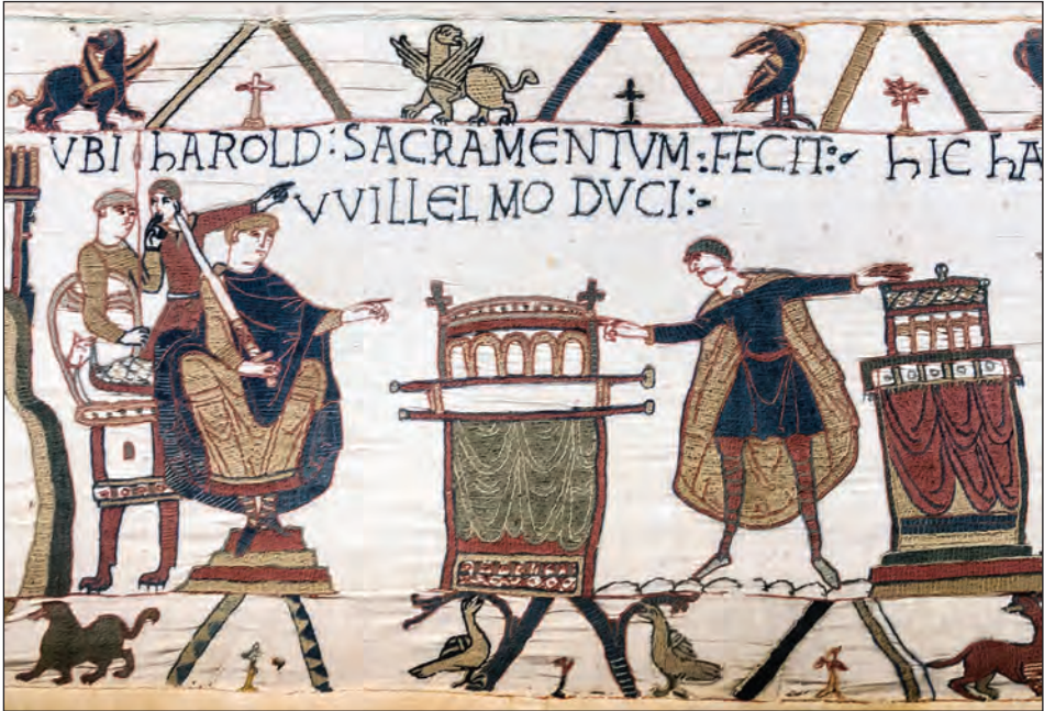
Fig. 5: HAROLD SACRAMENTUM FECIT VVILLELMO DUCI : “Harold made an oath to Duke William” (Bayeux Tapestry). This scene is said in the previous scene on the Tapestry to have taken place at Bagia (Bayeux, probably in Bayeux Cathedral). It shows Harold touching two altars with the enthroned Duke looking on, and is central to the Norman Invasion of England ( https://en.wikipedia.org/wiki/File:Bayeux_Tapestry_scene23_Harold_sacramentum_fecit_Willelmo_ducit.jpg )

arbiters (Lat. amicabilis compositor , Ger. compromitendt , schidman , Mne. kmet , arbitar , Alb. pleqnarët ). Generally there were an equal number of arbiters for both parties, and they were chosen and accepted by both based on their moral virtue and legal competence: respected members of society, e.g. village elders, clergy, representatives of urban authorities, influential local nobility or distinct keepers of legal customs or professional jurists (notaries, lawyers). In Medieval and early modern communities across Europe, 18 where both customary and the Roman legal order coexisted, at the beginning of the arbitration the parties to the conflict had to notify the arbiters as to whether they wished to settle according to law or according to custom (Lat. per viam iuris vel per amicabilem viam ,