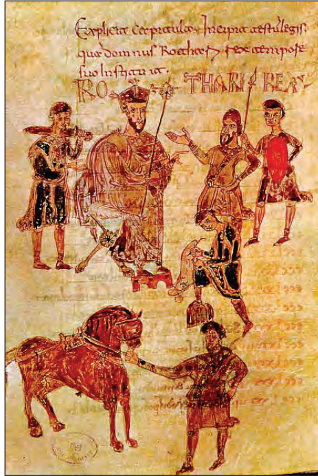
Fig. 1: King Rothar enthroned (detail). Edictum Rothari ( http://www.studiarapido.it/wp-content/uploads/2014/11/editto-rotari-3.jpg )

The most common straightforward term for vengeance in the sources is the Latin vindicta , from which originate the Romance words for vengeance like the Italian vendetta and the French vengeance (Büchert Netterstrøm, 2007, 39). However, vindicta originally also has multiple meanings: vengeance, (the staff of) manumission, punishment, redress and satisfaction, and vindication (Bradač, 1980, 576). From vindicta also seem to stem the French words vindiquer and revindiquer and the German vindizieren , all of which express a claim or right. From Latin vindicare , to vindicate, via Old French vengeance or venjance and revengier or revenchier also seem to originate the English words vengeance and revenge respectively. 11 The Latin ultio is often reserved for divine retribution ( ultio divina ) (cf. Wallace-Hadrill, 1959, 465–466), while in German sources Rache is far less common for the custom of vengeance (cf. MGH, Const. 2, 196a., 253) than words and phrases for enmity. In the Slavic-speaking regions of Southeastern Europe the most com-