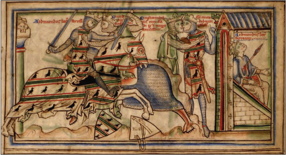
Fig. 6: Kiss of Peace settling the enmity. Cambridge Ee.3.59, The Life of King Edward the Confessor , ca. 1250–1260 ( http://manuscriptminiatures.com/4450/10071/ )