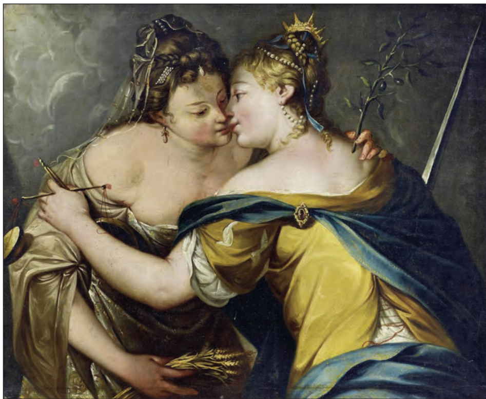
Fig. 7: Kiss of Peace between Justice and Peace . Giovanni Battista Tiepolo (1696–1770) ( https://commons.wikimedia.org/wiki/File:Tiepolo_Justice_and_Peace.jpg )

orfeyde, vrvehe vnd si svne, gantze sūne, gantz ab vnd verrichtet ). 24 Composition settled all damages, including the treatment and care of the victim, and the costs of funerals, lawsuits, and trials. In Christianity settling blood included requiems for the victim's soul and the erection of memorials. Penance for homicide was also imposed by fasting, a temporary ban from attending church services, a pilgrimage, by giving alms, etc. In some areas following the peace the killer had to avoid the victim's kin as much as possible for a year and a day. Elsewhere, peace was demonstrated by sharing common meals or sleeping in the same bed, i.e. convivia (van Eickels, 1997, 137–139; Brown, 2011, 40). Always, however, by-gones had to be by-gones, as propriety demanded that the conflict had to be forgotten. Following the ritual ceremony of peacemaking in Christianity both parties jointly